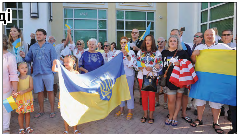
Живий ланцюг учасників свята.