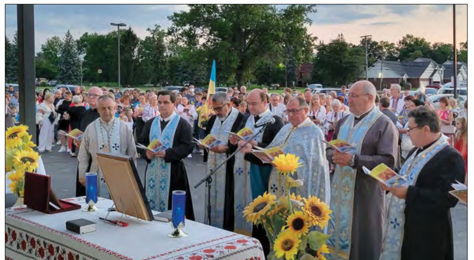
Молебень відслужило духовенство з п'яти парафій.