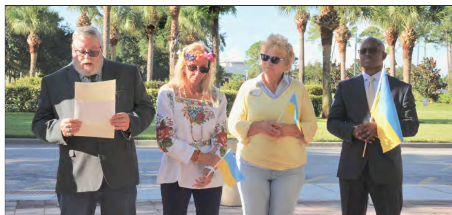
Урядовці міста Норт Порт.

У своєму слові від Громадського комітету Дарія Томашоска накреслила історію боротьби українського народу в ХХ-ХХІ століттях, щоб бути незалежною, європейською державою і жити мирно з сусідами. Але Москва та її провід ніяк цього не хоче і вже півроку провадить жорстоку війну, щоб підкорити Україну і її народ. З поміччю Америки та вільного світу Україна таки перемаже ворожу брутальну силу.