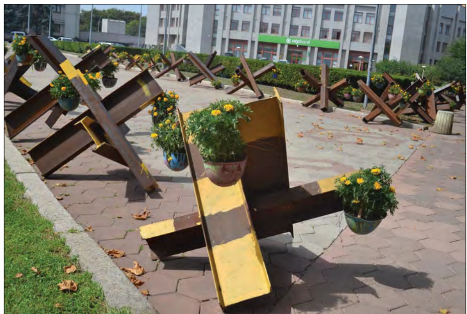
На протитанкових їжаках висадили чорнобривці.