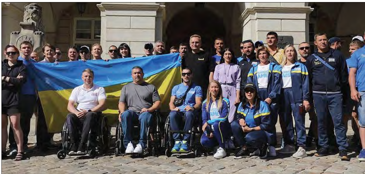
Збірну України на „Іграх воїнів” зустріли у Львові.

ЛьВІВ. – 1 вересня у Львові зустріли збірну України, яка привезла зі спортивних змагань „Ігри воїнів” („Warrior Games”) 93 медалі, завдяки чому посіла друге місце в загальному рейтингу, поступившись першістю лише команді зі США.