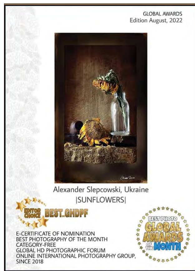
Сертифікат з Індії.