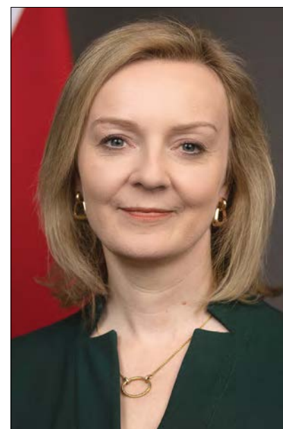
Ліз Трасс стала третьою жінкою на посаді прем'єра Об'єднаного Королівства.

му, вона публічно висловила сумнів щодо твердження Міністра закордонних справ Сергія Лаврова, що накопичення військ на кордонах України начебто нікому не загрожує. Через два тижні Росія напала на Україну.