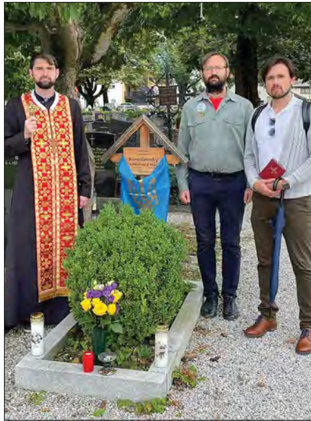
Біля могили Міністра земельних справ УНР Миколи Ковалевського.

М. Миколайович Ковалевський народився 3 вересня 1892 року на Чернігівщині. Помер 18 серпня 1957 року в Інсбруку. У 2008 році зусиллями Посла України Євгена Чорнобривка віднайдено та оплачено оренду могили. У 2017 році стараннями української громади Інсбрука та пароха о. Володимира Волошина та студентів богословів о. Володимира Мамчина та о. Романа Птасюка було впорядковано могилу. У червні того