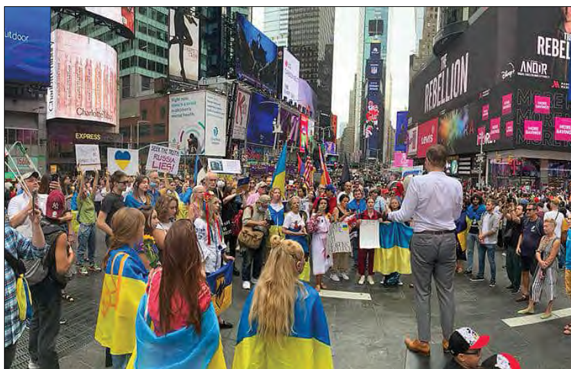
Під час акції протесту на Таймс Сквер.

Учасники маніфестації засудили поширення засобами російської пропаганди, зокрема за кордоном, викривлених фактів про минуле та сьогодення України, закликали міжнародну спільноту відкрити для себе Україну – її правдиву історію, багатовікові традиції Українського народу та яскраву й самобутню українську культуру. Акцію провела організація „Razom for Ukraine“.