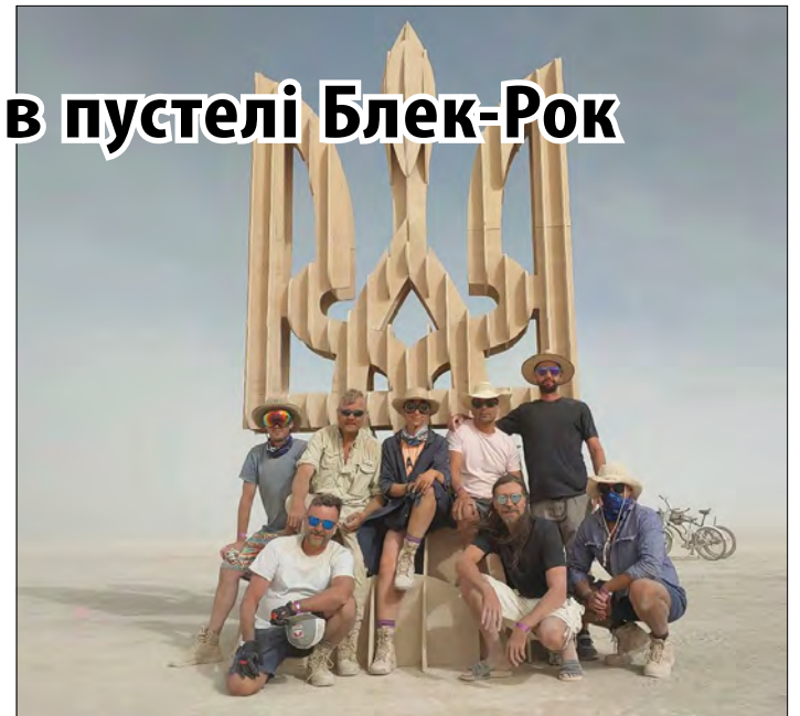
Автори інсталяції „Тризуб свободи“