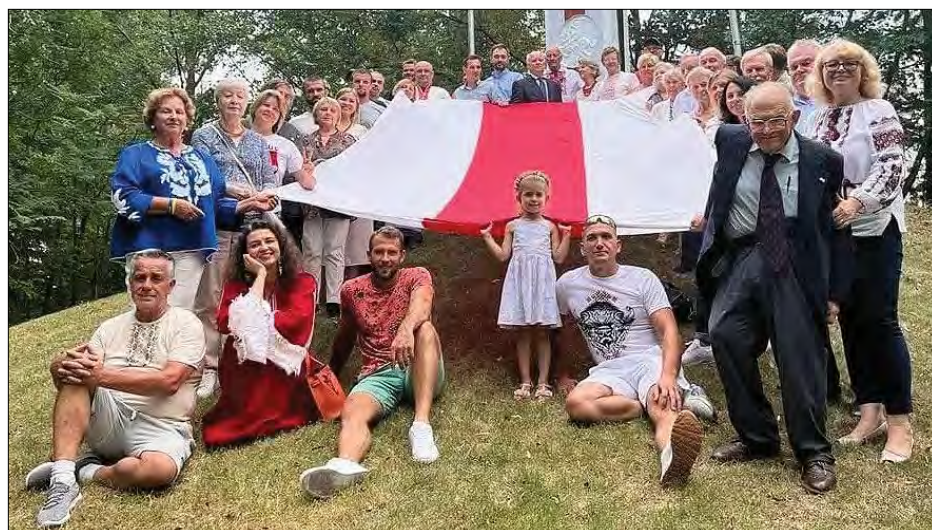
Учасники зустрічі білорусів Північної Америки.

Другого дня було відзначено 100-річчя Білоруської автокефальної православної церкви Божою службою у Церкві Жировицької ікони Божої матері в Гайланд Парку, Нью-Джерсі. Службу очолив Архiepіскоп Святослав у сослуженні настоятеля митрофорного протерея Зіновія Жолобака і численних свяще-