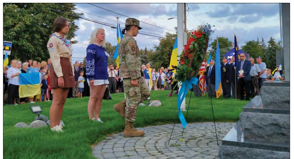
23 серпня покладено вінок жертвам війни.