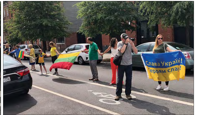
Акція „Живий ланцюг“ в Нью-Йорку.