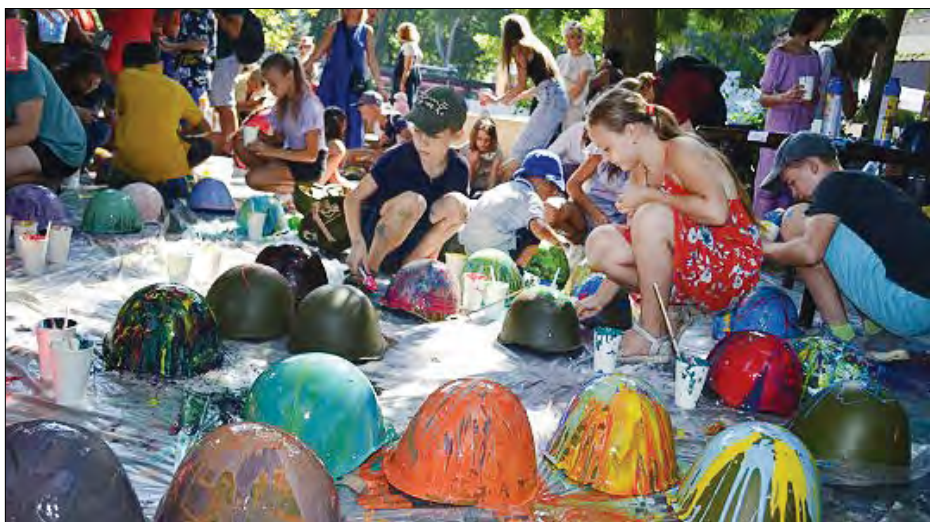
Шоломи розмалювали маленькі одесити.

Як зазначив під час відкриття міський голова Геннадій Труханов, інсталяцію планують відправити до міста-партнера Венеції, щоб показати всьому світу ціну, яку платить Україна у війні проти російських окупантів.