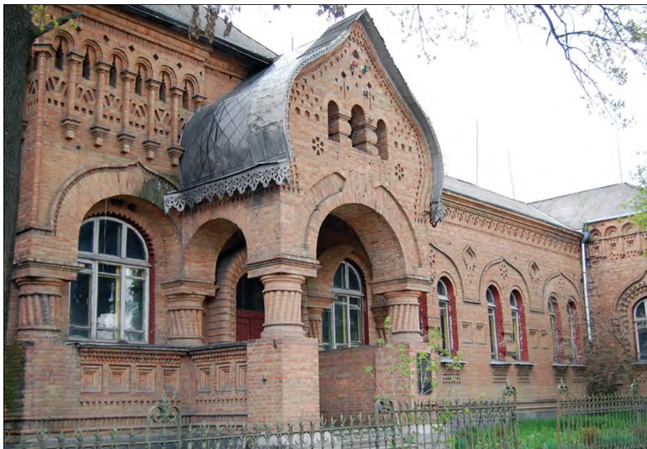
Приміщення майбутньої водолікарні.