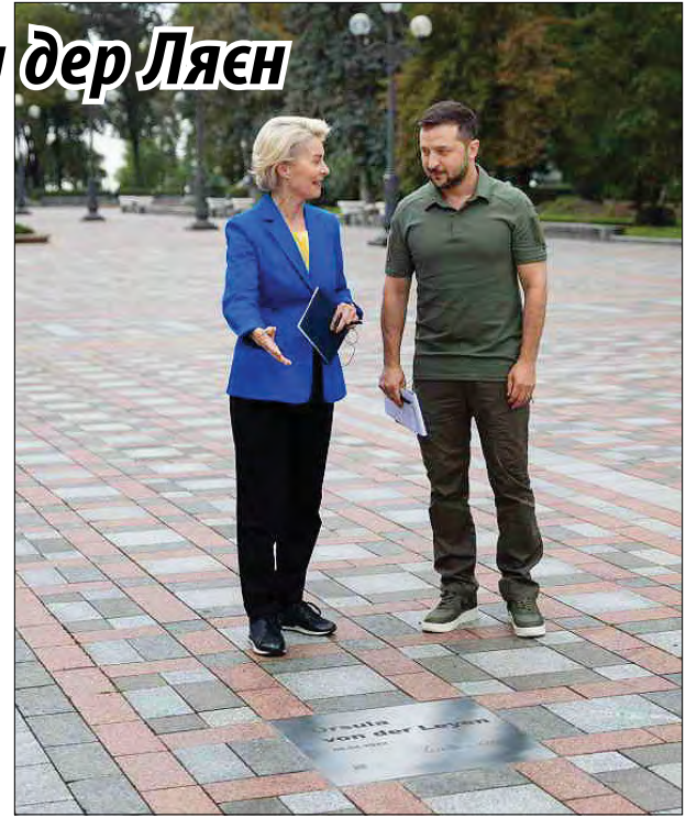
Президент України Володимир Зеленський і Президент Європейської комісії Урсула фон дер Ляєн на відкритті символічної таблички в Києві (Фото: Офіційне інтернет-представництво Президента України)

Офіційне інтернет-представництво Президента України