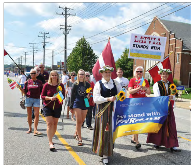
До паради на честь 31-ої річниці Незалежності України долучилися поляки (зліва), литовці (посередині) та латиші.