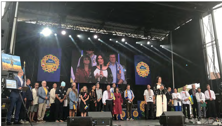
Український фестиваль „Bloor West Village Toronto Ukrainian Festival“.