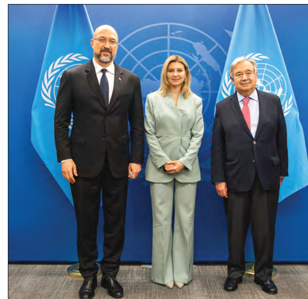
Перша леді України Олена Зеленська та Прем'єр-міністр України Денис Шмигаль (ліворуч) під час зустрічі з Генеральним секретарем ООН Антонію Гутеррішем.