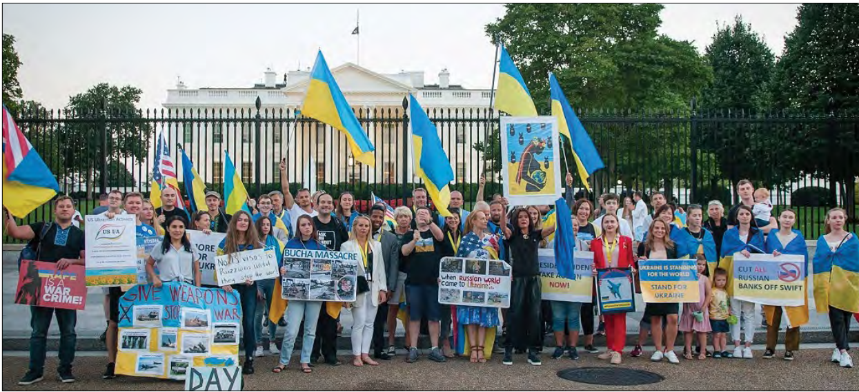
Руслана Лижичко з піднесеним плякатом під час акції активістів під Білим домом.

ВАШІНГТОН. – Українська співачка, переможниця Євробачення-2004, народна артистка України, громадська активістка Руслана Лижичко під час візиту до Вашингтона 19 вересня приєдналася до акції активістів під Білим домом на підтримку України.