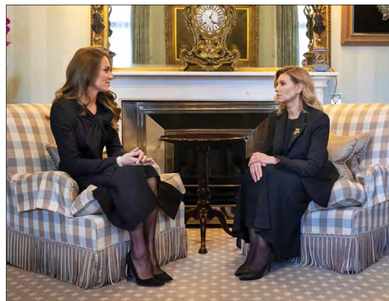
Олена Зеленська зустрілася з Кейт Міддлтон, принцесою Уельською.