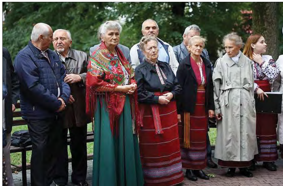
Вшанування пам'яті жертв депортації.