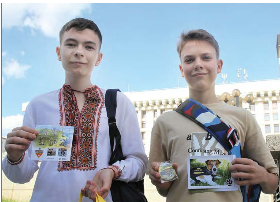
Молоді патріоти-філателісти серед перших володарів маркового комплексу з Патроном.