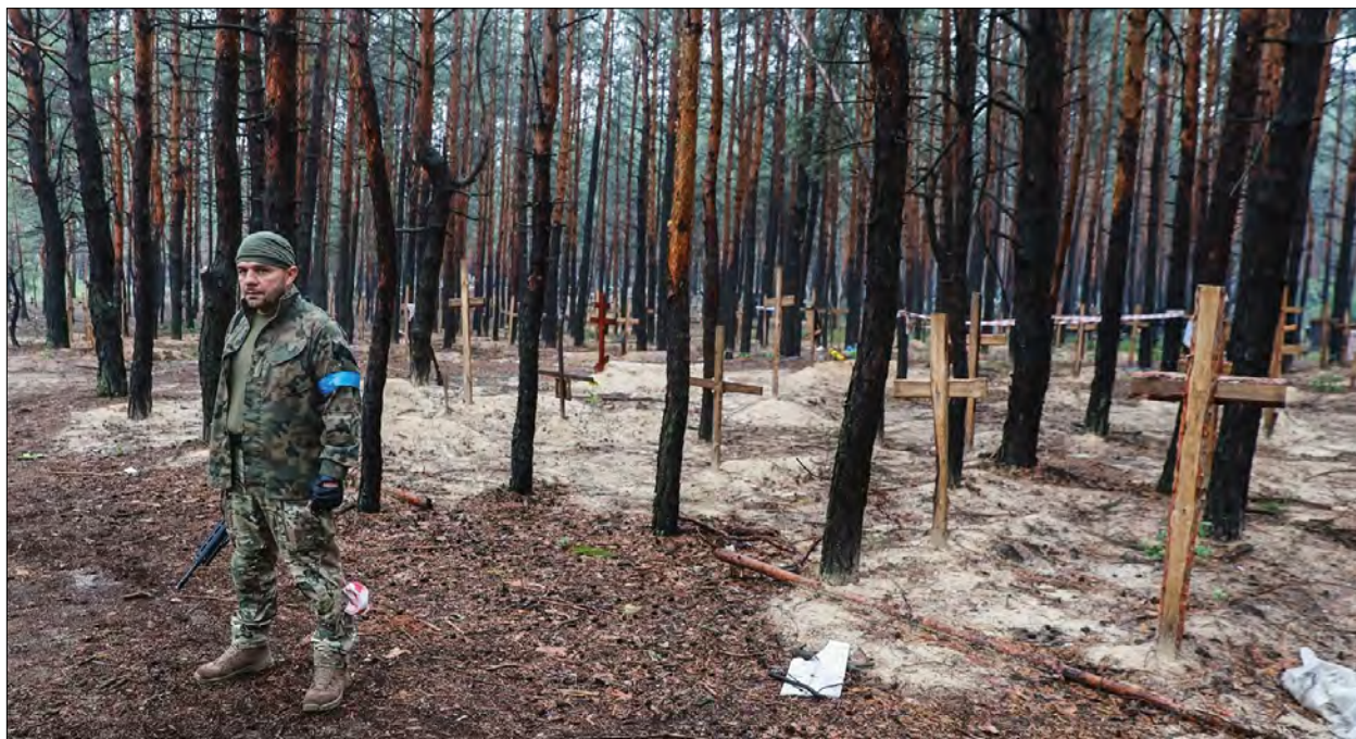
Поховання жертв росіян поблизу Ізюма.

ІЗЮМ, Харківська область. – У звільненому від російських окупантів місті знайшли близько 500 поховань цивільного населення. І поки встановлена одна могила, де масово поховані приблизно до 20 військовослужбовців Збройних сил України. Українські військові були знайдені застреленими із зв'язаними позаду руками. Ймовірно, що загиблі військові були полоненими. Правоохоронці вважають, що їх спочатку катували, а потім стратили. Це