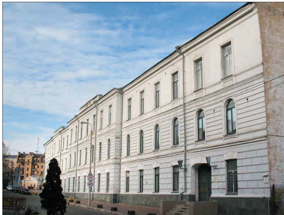
Старий контрактовий будинок. (Фото: Іван Парнікоза, 2014)