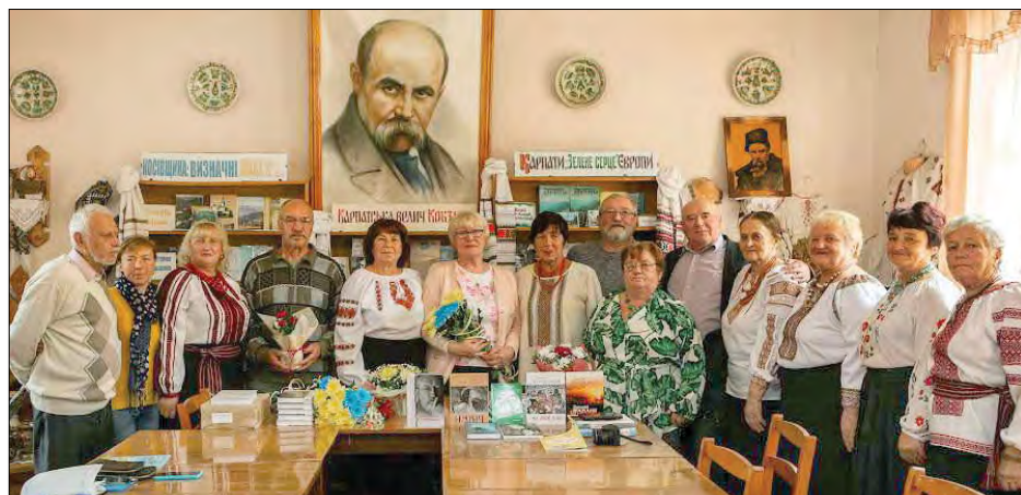
У світлиці Косівської міської бібліотеки.