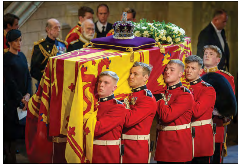
Похорон королеви Єлизавети II.

У Вестмінстерському абатстві О. Зеленська