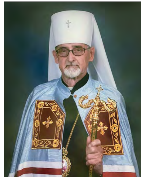
Митрополит Іван (Стінка)

Ділимося сумною вісткою, що 19 вересня в Саскатуні на 88-му році життя спочив у Господі колишній першоєрарх Української Православної Церкви в Канаді, Митрополит Іван (Стінка). Просимо молитов за душу новопреставленого архієрея нашої Церкви!