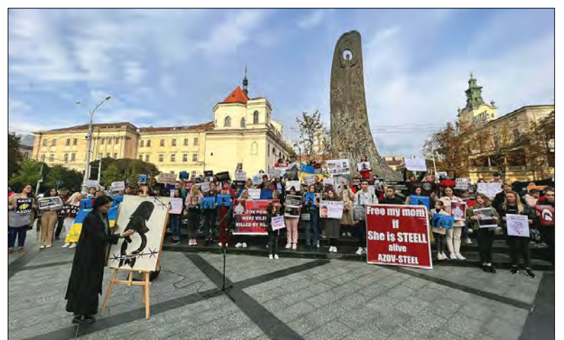
Акція на підтримку жінок-військовополонених у Львові.