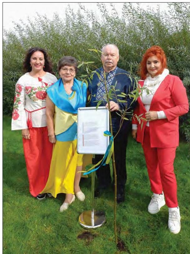
Учасники церемонії в Оранієнбургу.