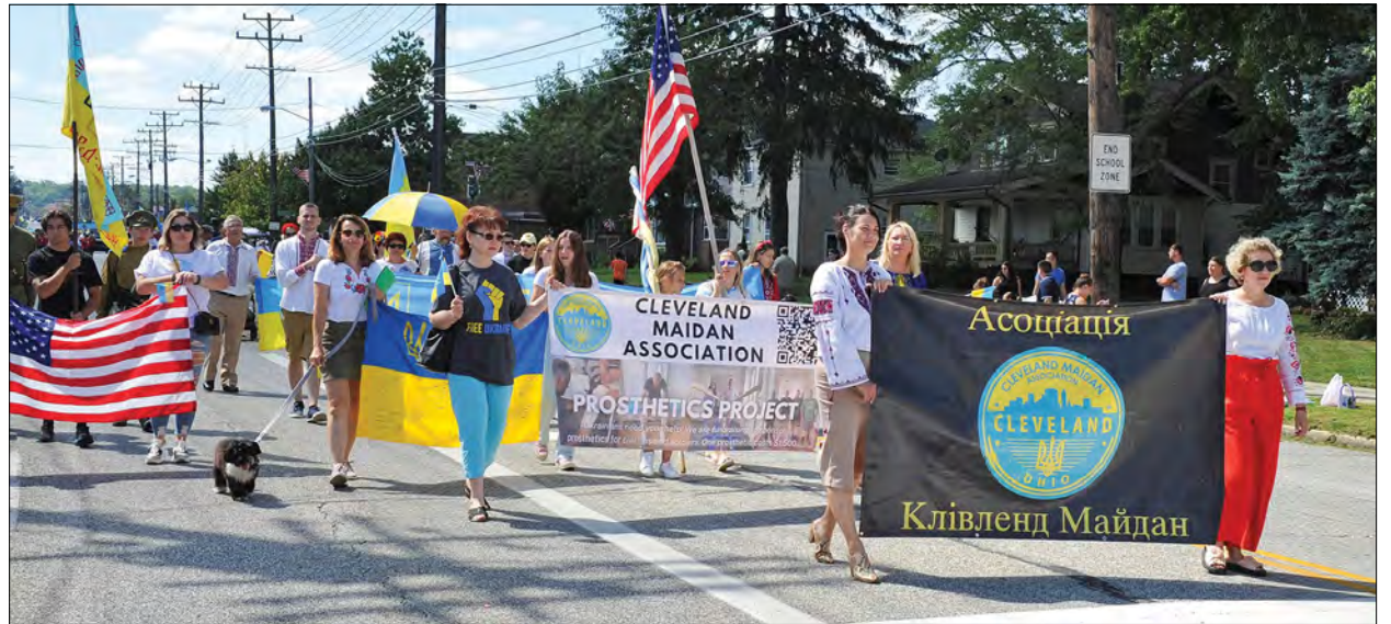
Представники Асоціації Клівленд Майдан крокують центральною вулицею Парми.