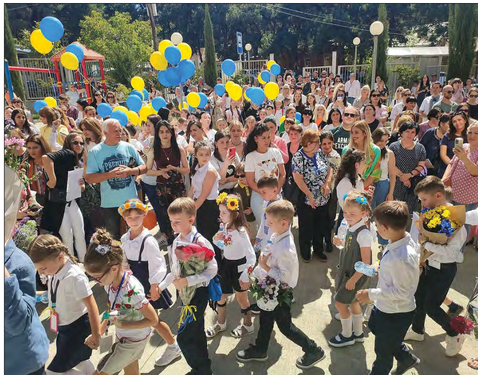
Відкриття української школи в Тбілісі.

ТБІЛІСІ. – Відбулося офіційне відкриття другої української школи в Тбілісі, де українські діти мають можливість продовжити освіту та постійно перебувати в україномовному середовищі своїх однолітків. Про це 19 вересня повідомило Посольство України в Грузії. Присутні побажали дітям успіхів у навчанні, опануванні нових предметів, включаючи вивчення грузинської мови та культури, розширення кола друзів,