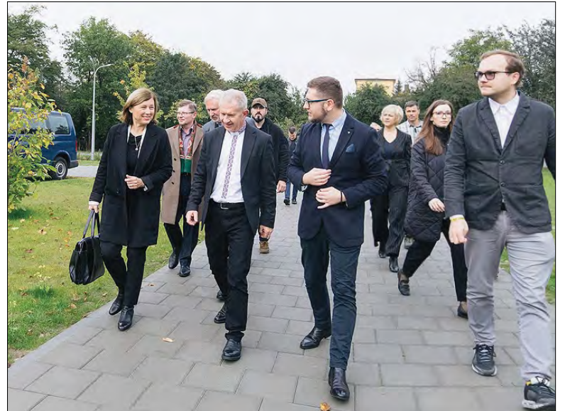
Віцепрезидентка Європейської комісії Віра Юрова (ліворуч) відвідує Український католицький університет.

Під час зустрічі ректор УКУ о. Богдан Прах наголосив: „У часі відбудови України, потрібно шукати нові рішення: як працювати з українцями й нашими партнерами. Ми бачимо, як світ сьогодні підтримує Україну. І хочемо вірити, що спільно досягнемо перемоги. Як університет ми є невеликою