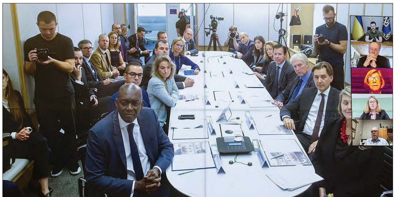
Учасники церемонії підписання документа про участь у фінансуванні фонду „Horizon Capital Growth IV”.

КИЇВ. – 26 вересня Президент України Володимир Зеленський у режимі відеоконференції узяв участь у церемонії підписання документа про участь у фінансуванні фонду „Horizon Capital Growth IV”. Це новий фонд, створений для інвестицій в українські компанії.