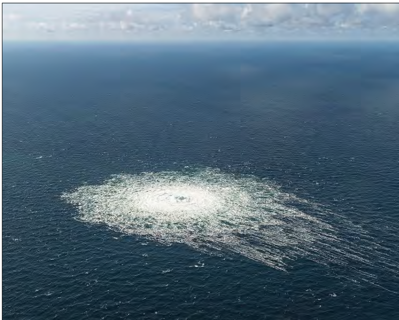
Вид з данського літака-перехоплювача F-16 на витік газу з „Північного потоку-2“ поблизу Дугеде, Данія, 27 вересня. Цей витік є одним із чотирьох на газопроводах „Північний потік“ у Балтійському морі; три інші розташовані на „Північному потоці-1“ поблизу Борнгольма.

В оборонному відомстві Великої Британії припускають, що Росія могла здійснити „навмисну і сплановану“ атаку на свої ж газопроводи „Північ-