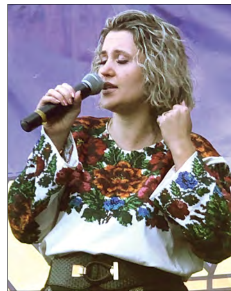
Заслужена артистка України Крістіна V.