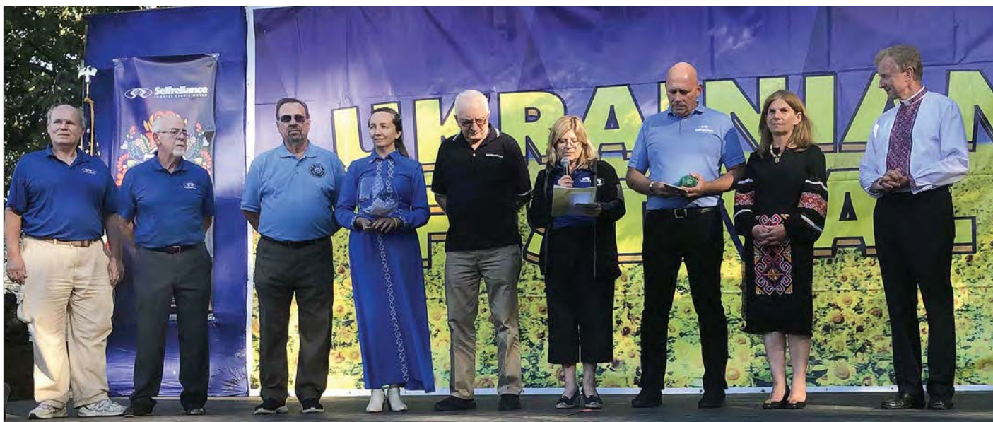
Делегація Української американської федеральної спілки „Самопоміч“.