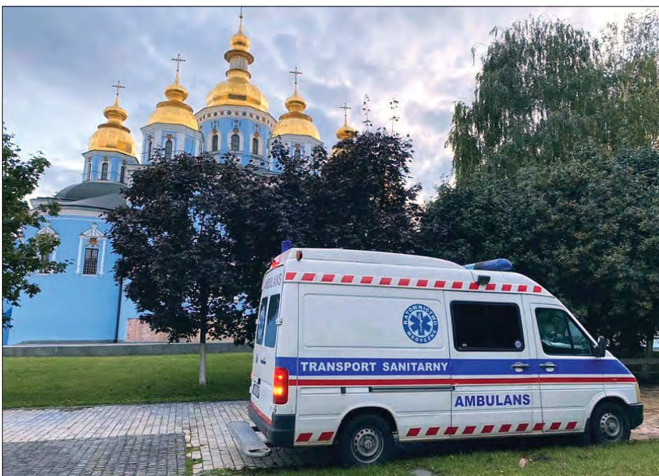
Одна з машин швидкої допомоги, яку УПЦ США доставила в Україну.

22 вересня Українська православна церква США доставила в Україну ще чотири машини швидкої допомоги в рамках постійної гуманітарної діяльності щодо порятунку життя.