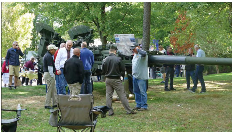
Показ гармати-гаубиці М777.