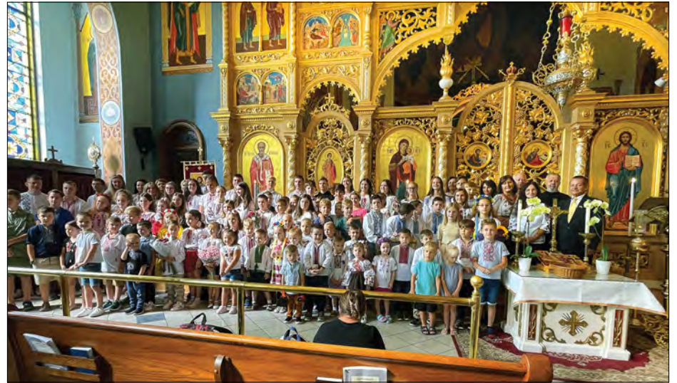
Учні та вчителі Школи українознавства ім. Лесі Українки.