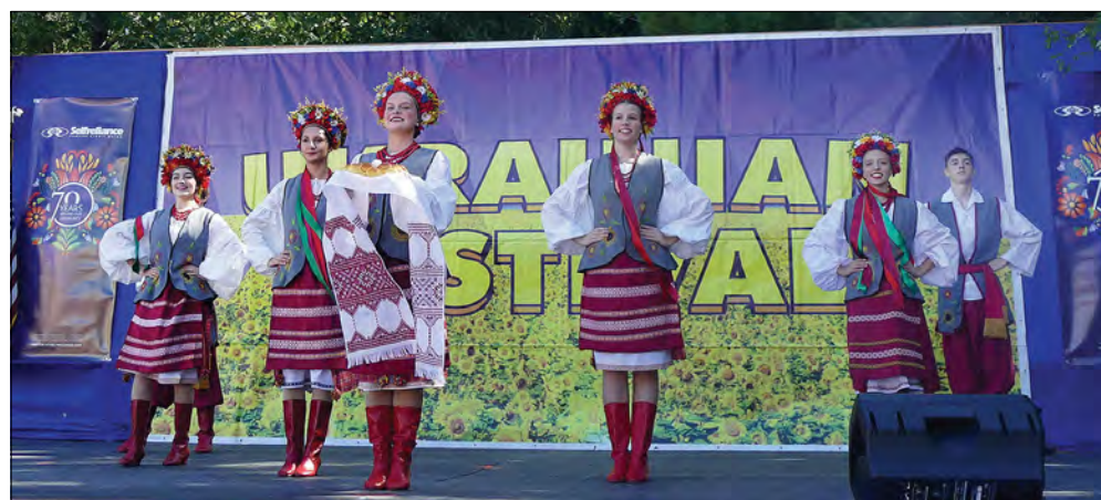
Основу концертної програми склали танці Школи та Ансамблю українського танцю „Іскра“, Школи українського народного танцю „Цвітка“ і танцювальної школи „Надія“.