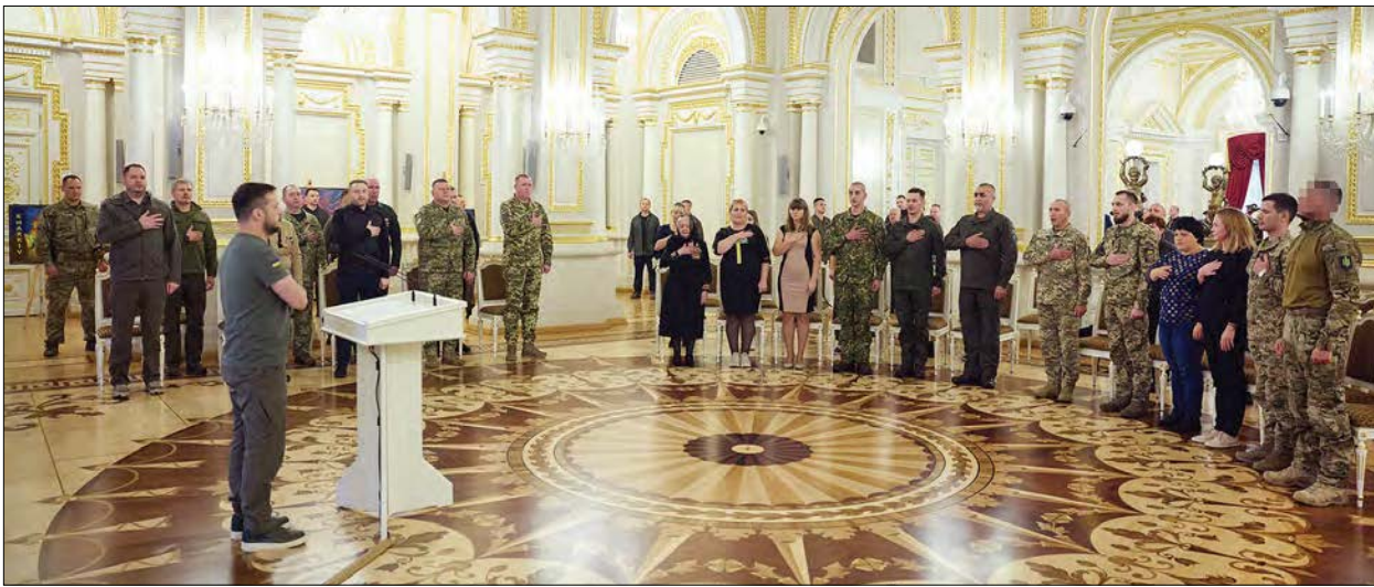
Урочиста церемонія нагородження в Білій залі героїв України в Маріїнському палаці.

КИЇВ. – 24 вересня Президент України Володимир Зеленський вручив ордени „Золота зірка“ військовослужбовцям, яким присвоєно звання Героя України, та членам родин загиблих захисників, удостоєних цього звання посмертно.