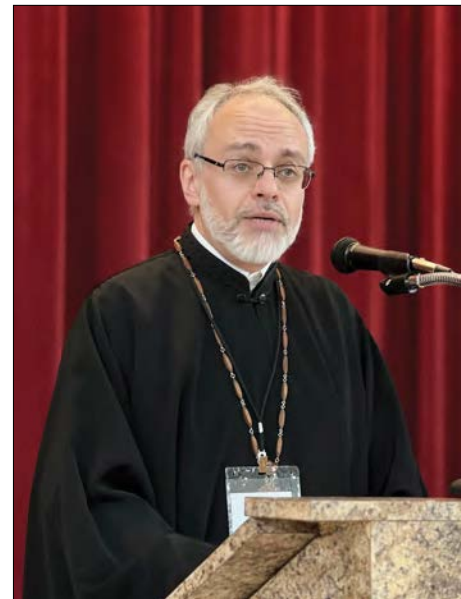
Промовляє архієпископ Даниїл.

Учасники пленарного засідання торкалися життєво важливої проблеми спільноти штату: 38 мільйонів людей у США відчувають нестачу їжі,