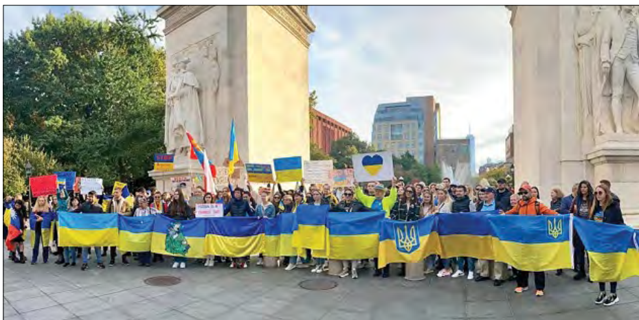
Віче українців в Нью-Йорку.

НЬЮ-ЙОРК. – На міській Washington Park Square українці та друзі України 22 жовтня провели черговий мітинг, лейтмотивом якого стало „Stop Partnering With Terroruzzia!“ Наголошувалося, що після злочинів, скоєних кремлівськими катами у Бучі,