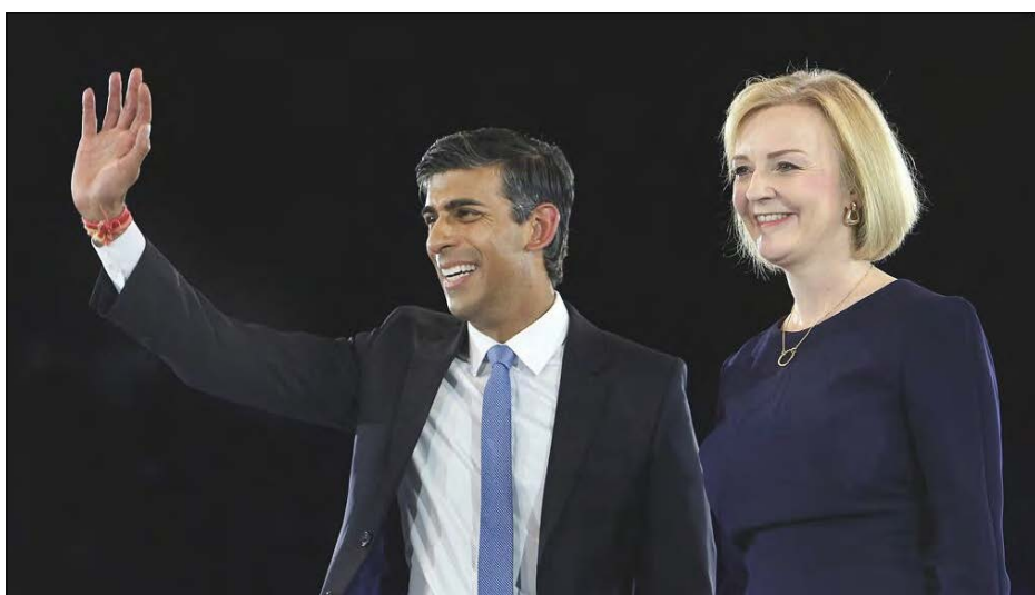
Ріші Сунак та його попередниця на посаді Ліз Трасс

ЛОНДОН. – 24 жовтня Ріші Сунак був обраний новим лідером британської Консервативної партії після того, як його суперники – колишній прем'єр-міністр Борис Джонсон та лідерка Палати громад Пенні Моргонт – вибули з гонки.