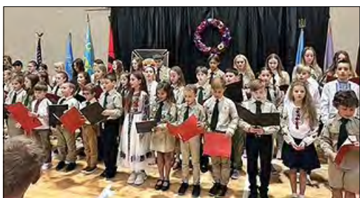
Юнацтво СУМ співає „Батько наш Бандера“.

Д-р М. Посівнич також президент фонду „Літопис УПА“ ім. В. Макара і один із засновників Центру досліджень визвольного руху ХХ століття