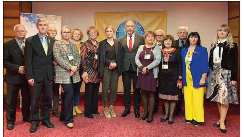
Учасники зустрічі представників СКУ від країн Східної Європи.