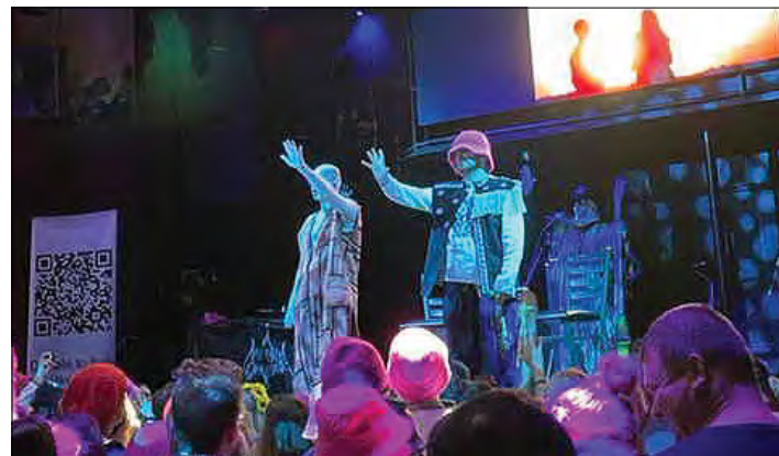
Творча зустріч українського поп-гурту „Kalush Orchestra“ з любителями сучасного естрадного мистецтва.

культура живе і розвивається, хоч її зараз і намагаються знищити, вирвати з корінням з рідної землі.