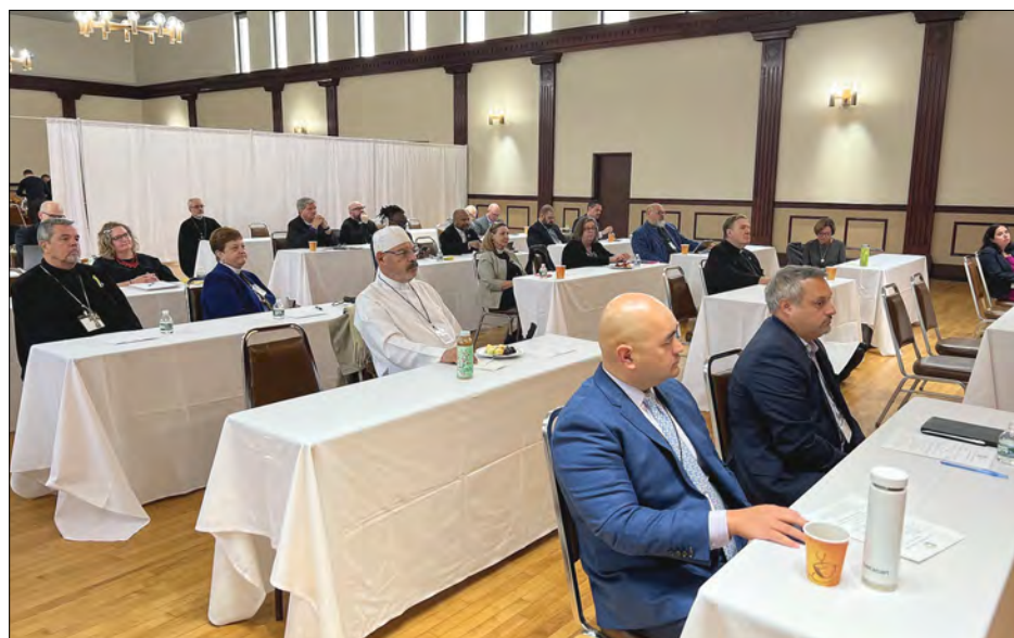
Учасники пленарного засідання коаліції.

близько 650 тис. людей у Нью-Джерзі стикаються з голодом щодня. З них 175 тисяч – діти. Коли їм не вистачає їжі, вони можуть зазнати прямого і драматичного впливу на свій фізичний розвиток і психічне благополуччя.