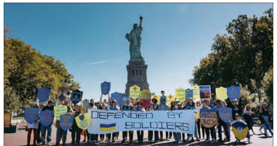
Українці під час акції на Острові Свободи.