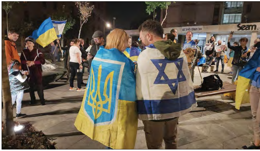
Віче в Єрусалимі.