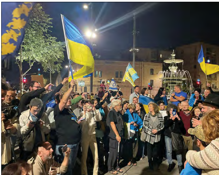
Масова акція на підтримку України в Єрусалимі.

ЄРУСАЛИМ. – Біля резиденції Прем'єр-міністра Ізраїлю Яіра Лапіда відбулася чергова масова акція на підтримку України з закликами до уряду єврейської держави надати військову допомогу Україні. Віче організувала ізраїльська неурядова організація „Ізраїльські друзі України“, яка направила звернення до уряду Ізраїлю. У документі, зокрема, наголошувалося на тому, що, оскільки зближення Росії та Ірану становить загрозу для безпеки і інтересів Ізраїлю, єврейська держава спільно з Україною і рештою цивілізованого світу повинна дати гідну відсіч російській агресії та сприяти стабільності на європейському континенті“. В Єрусалимі вперше показали всесвітньовідомі сучасні українські фільми про кохання, людяність, війну та надію.