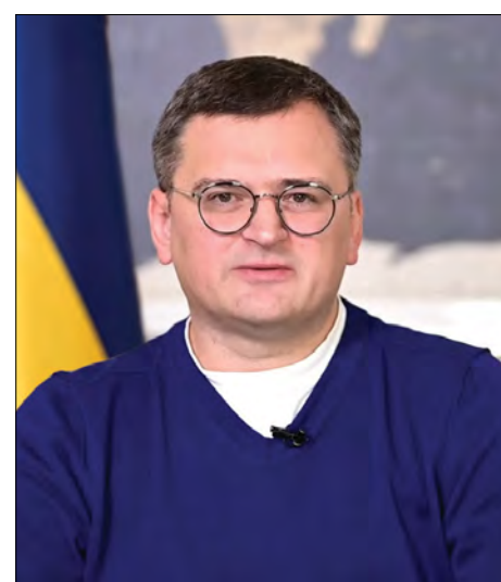
Міністер закордонних справ України Дмитро Кулеба

Міністер оборони Росії Сергій Шойгу в розмовах з міністрами оборони Франції, Туреччини, Великої Британії та США звинуватив Україну в підготовці „брудної бомби”. Російські чиновники бездоказово кажуть про контакти офісу Президента України з представниками Великої Британії для отримання технології створення ядерної зброї. Підриг такого боеприпасу можна буде замаскувати під позаштатне спрацювання російського ядерного боеприпасу малої потужності, в якому як заряд використовується високозбагачений уран, цитує російська агенція „РІА Новини” представників Міністерства оборони Росії. Україна та країни Заходу кате-