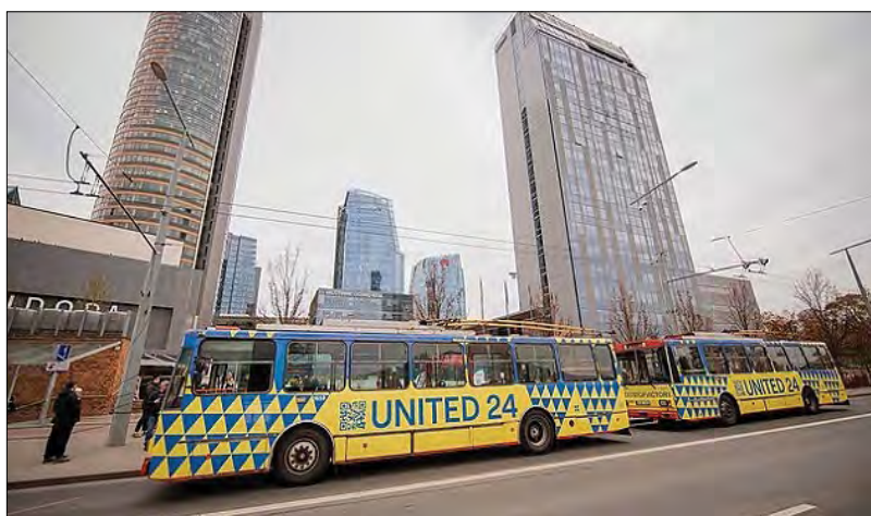
Синьо-жовті троллейбуси у Вільнюсі.

В основу дизайну трамваю у Відні та троллейбусів у Вільнюсі закладено елементи графічних робіт видатного українського дизайнера Георгія Нарбута, творця перших українських банкнот та поштових марок. Також на троллейбусах у литов-