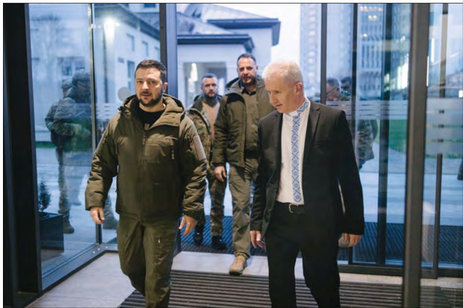
Президент України Володимир Зеленський з ректором УКУ о. Богданом Прахом.

ЛьВІВ. – 11 січня з неофіційною візитою Український католицький університет (УКУЦ) відвідав Президент України Володимир Зеленський, який зустрівся з ректором УКУ о. Богданом Прахом.