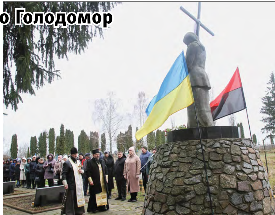
Відзначення 90-річчя трагедії біля першого пам'ятника жертвам Голодомору-геноциду на Київщині.