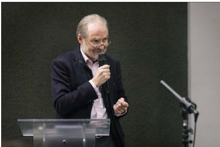
Історик Тімоті Еш під час лекції в УКУ.

ЛьВІВ. – Один із найбільш цитованих істориків сучасності Тімоті Еш прочитав відкриту лекцію в УКУ на тему „From Post-War Europe to Post-Wall Europe – and Back“. Історик проаналізував історичні події в Європі з часу Другої світової війни та до сьогоднішньої війни в центрі Європи, яку розв'язала Росія проти України. Провадив дискусію професор УКУ, історик Ярослав Грицак.