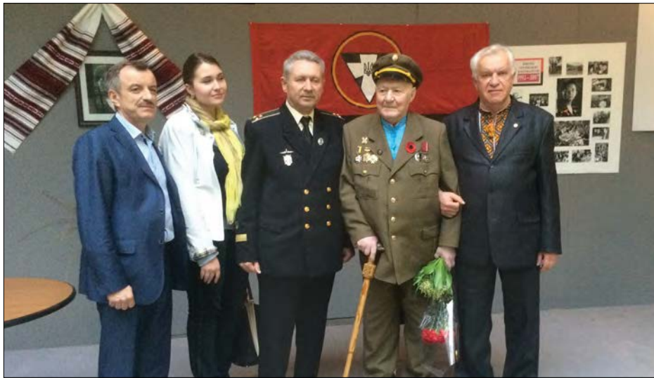
На відзначенні 100-річчя Героя України Мирослава Симчича.

„З нами Бог!“ Ці слова надихають і наповнюють нас силою звитяги добра над злом. Ми віримо в перемогу! І зміни в державі починаються з самосвідомості та сміливих кроків. Адже, „людина створена Богом для миру, що є ознакою присутності й дії Святого Духа“ (Гал. 5, 22-23). З миром у душі, з вірою та любов'ю святкуймо Різдво Ісуса Христа і проживімо щасливо Новий 2023 рік. Дякуємо Богові за всі отримані ласки і за випробування! Із 100-річчям вітаємо Героя України Мирослава Симчича („Кривоноса“), легендарного сотенного Української повстанської армії! Силою любови до Батьківщини та невтомною працею наслідуймо борців національно-визвольного руху і героїв нашого часу. Збагачуймо скарбницю духовності нашого народу. Хай радість перемагає смуток, а небесне світло – темряву. Єднаймося і будьмо сильні!