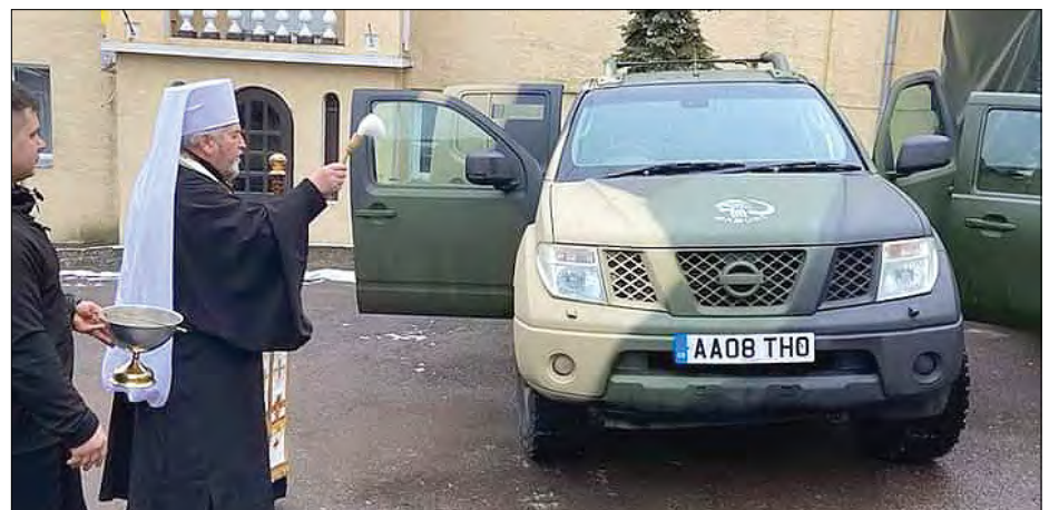
Митрополит Василь Семенюк благословляє автомобілі для військових.

Разом з автомобілями військові капеляни доставили дрон, 100 комп-