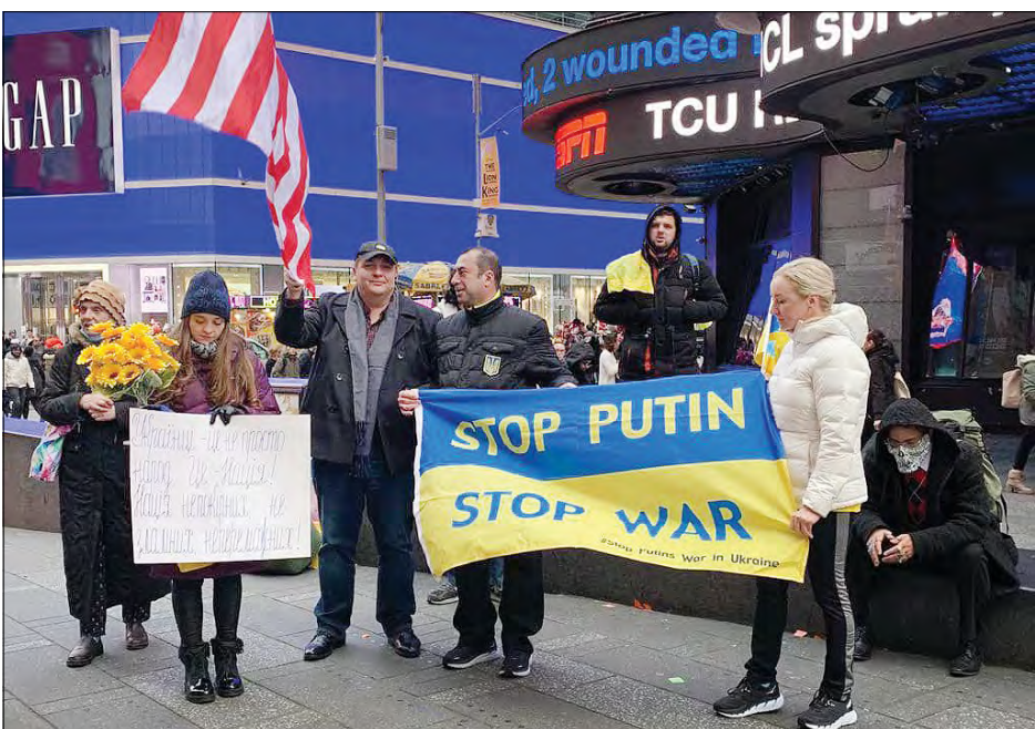
Учасники акції в Нью-Йорку.

НЬЮ-ЙОРК. – На Таймс-сквер українська громада разом з представниками американської громадськості провела перше цьогорічне віче на підтримку України.