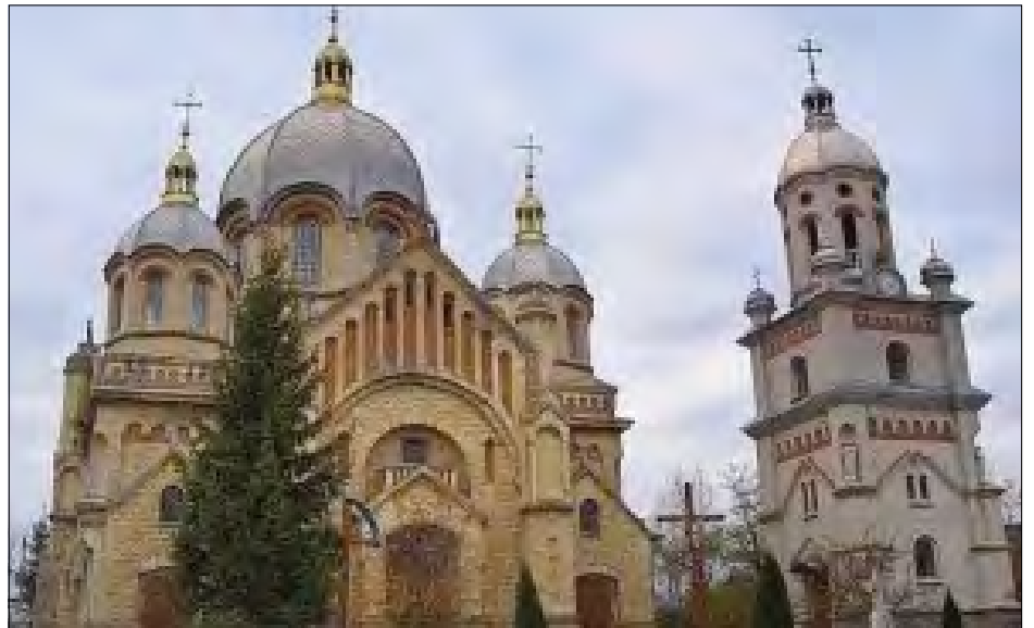
Греко-католицька церква в Товстому, збудована Яном Сас-Зубрицьким.