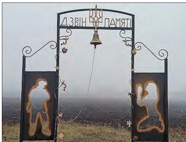
Дзвін пам'яті у селі Созонівка.