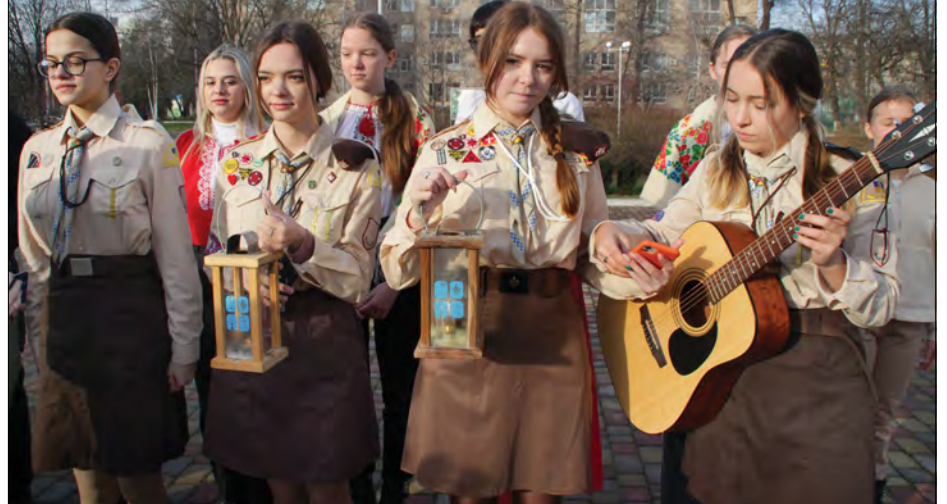
Біля університетського храму лунали колядки.