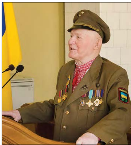
Герой України Мирослав Симчич.

„З нами Бог!“ Ці слова надихають і наповнюють нас силою звитяги добра над злом. Ми віримо в перемогу! І зміни в державі починаються з самосвідомості та сміливих кроків. Адже, „людина створена Богом для миру, що є ознакою присутності й дії Святого Духа“ (Гал. 5, 22-23). З миром у душі, з вірою та любов'ю святкуймо Різдво Ісуса Христа і проживімо щасливо Новий 2023 рік. Дякуємо Богові за всі отримані ласки і за випробування! Із 100-річчям вітаємо Героя України Мирослава Симчича („Кривоноса“), легендарного сотенного Української повстанської армії! Силою любови до Батьківщини та невтомною працею наслідуймо борців національно-визвольного руху і героїв нашого часу. Збагачуймо скарбницю духовності нашого народу. Хай радість перемагає смуток, а небесне світло – темряву. Єднаймося і будьмо сильні!