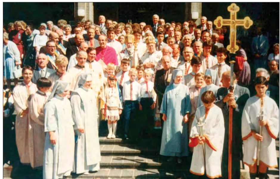
Патріарх Мирослав кардинал Любачівський в Австралії у 1986 році.