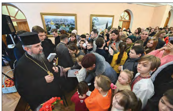
Митрополит Епіфаній відвідує дитяче свято.