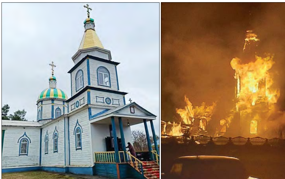
Храм до і під час пожежі.