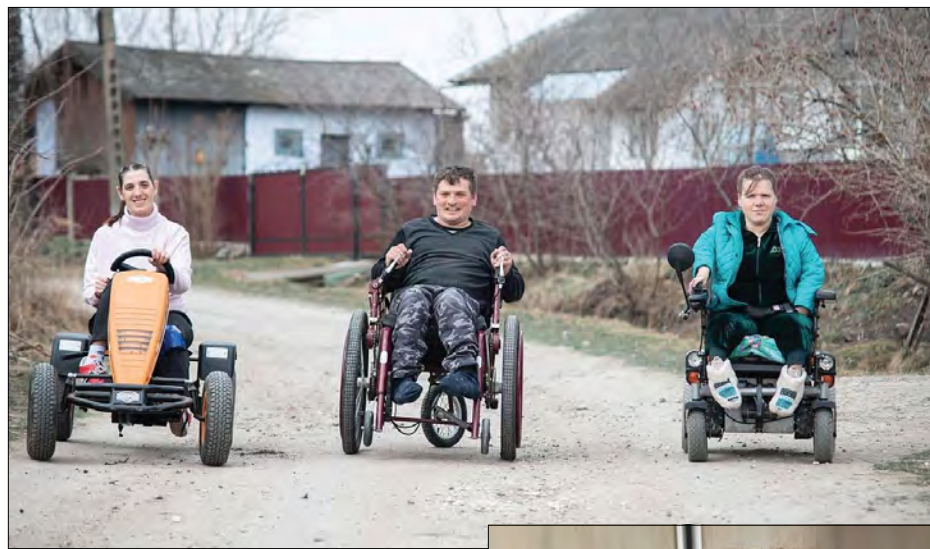
Мешканці Оселі Віри, Надії, Любові.

У грудні 2022 року будинок сиріт з інвалідністю „Оселя Віри, Надії, Любові“ отримав допомогу від Української православної церкви США – пожертву в сумі 11 тис. дол. Завдяки цій допомозі вдалося завершити роботи з підключення генератора, встановити два кондиціонери, закупити засоби індивідуального обігріву. Завдяки цій допомозі оселя зможе існувати орієнтовно до кінця літа 2023 року навіть за повної відсутності бюджетних коштів.