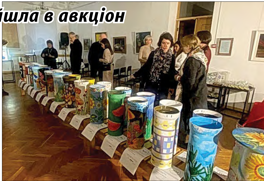
На виставці-авкціоні.

Усі твори були представлені на аукціоні, що відбувся 15 грудня, а отримані кошти спрямовані на