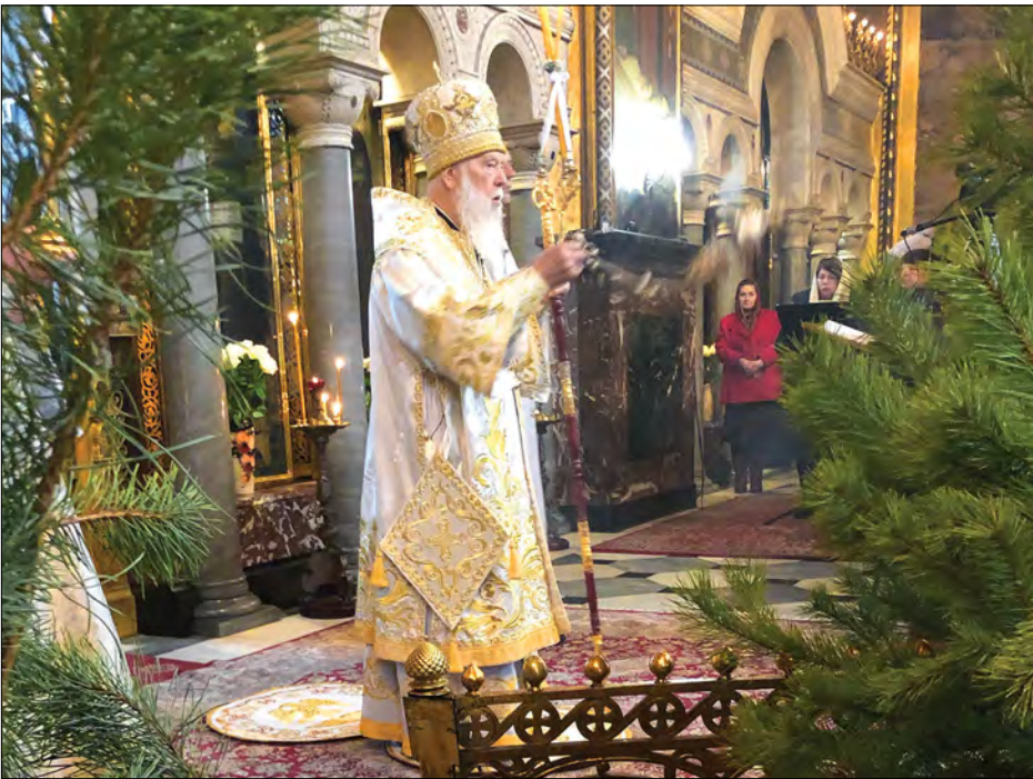
У Володимирському соборі править Патріарх Філарет.