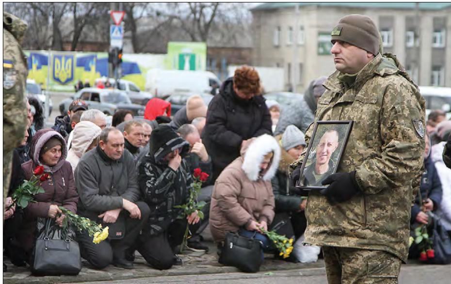
Прощання з полеглим на Майдані Слави в Смілі.