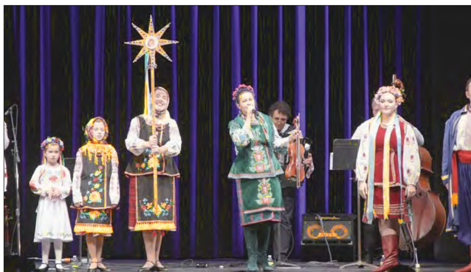
Концерт „Різдво в Україні“.

ВАШІНГТОН. – В одному з найбільших мистецьких осередків США – „Кеннеді центрі“ – 29 грудня 2022 року відбувся концерт „Різдво в Україні“, під час якого прозвучали старовинні колядки з різних регіонів України. Різдвяну програму підготував гурт „Gerdan“, щоб показати її у Вашингтоні напередодні зимових свят.