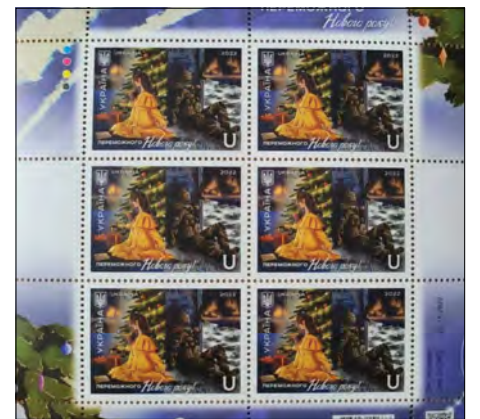
Новорічна поштова марка

Конкурсний ескіз видозмінено з урахуванням побажань учасників народного голосування: на підвіконні запалені свічки – невід'ємний атрибут року, що минає, а поле бою