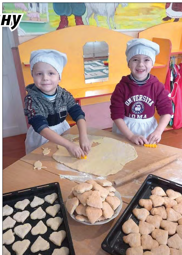
Діти виготовляють святкові пряники військового.

У Тернополі волонтери роздали подарунки бідним дітям та родинами жінок від баварських школярів з Німеччини, які виявили солідарність з Україною під час війни.