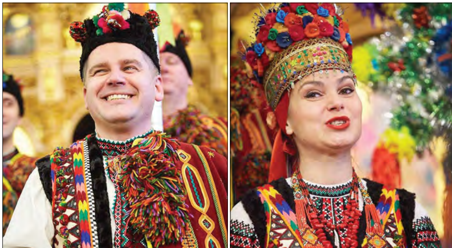
Перші учасники фестивалю з ансамблю „Гуцулія“.