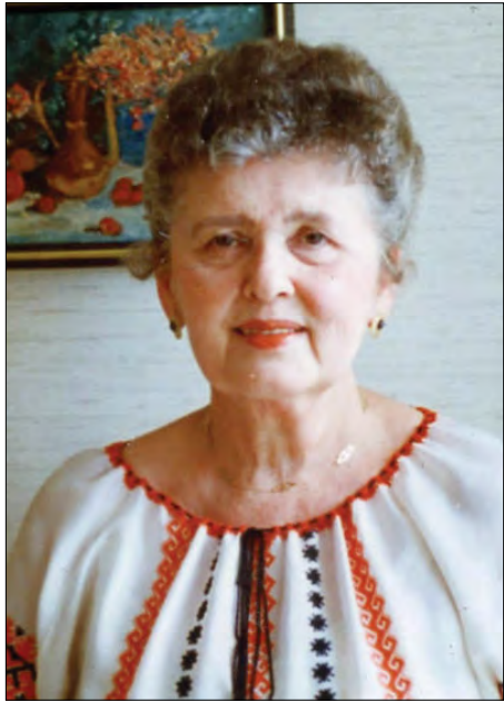
Св. п. Ольга Городецька