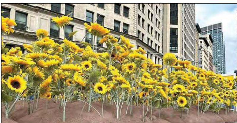
Висадили в Нью-Йорку понад 300 соняшників, (Фото: МЗС України)