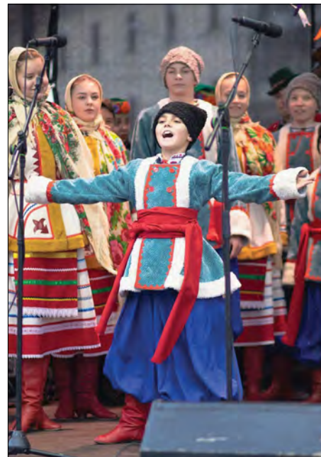
На сцені – народний хореографічний ансамбль „Світанок“.

В Угорщині колектив виступав у парламенті та на центральних площах Будапешту й Дебрецена. Магічне українське різдвяне дійство відбулося й перед палацом Шенбрун в австрійському Відні. Потім „Щедрик“ лунав у Президентському палаці. Звучали українські колядки й у Братиславі та Празі. На концерти артис-