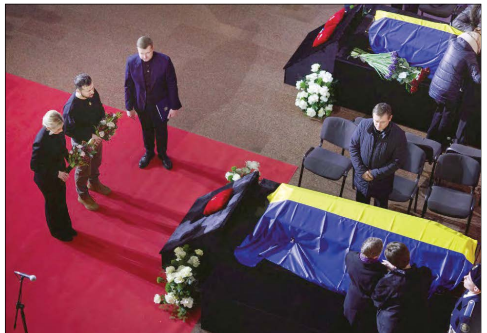
Президент України Володимир Зеленський з дружиною Оленою під час прощання з керівниками та працівниками Міністерства внутрішніх справ.

КИЇВ. – Президент України Володимир Зеленський разом із дружиною Оленою 21 січня взяв участь у церемонії прощання з керівниками та працівниками Міністерства внутрішніх справ, які загинули 18 січня внаслідок падіння гвинтокрила у Броварах на Київщині.