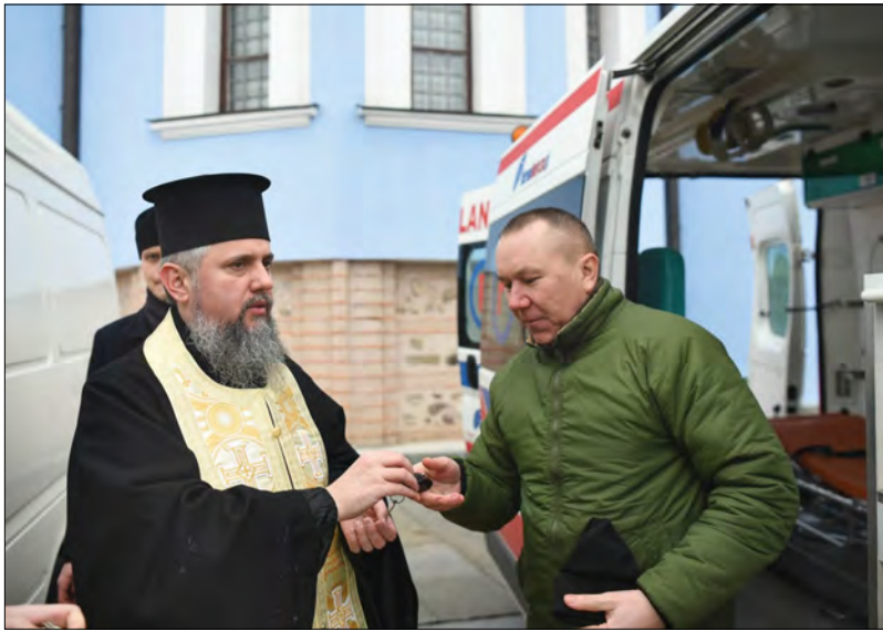
Митрополит Епіфаній передає автомобілі для ЗСУ.

Митрополит Київський і всієї України Епіфаній на території Свято-Михайлівського золотоверхого монастиря звершив освячення автомобілів, які разом з амуніцією та лікарськими засобами було передано воїнам – захисникам України.