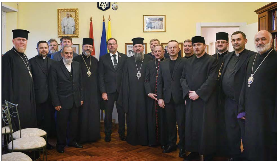
Делегація Всеукраїнської ради церков і релігійних організацій в Римі.

РИМ. – Представники Всеукраїнської ради церков і релігійних організацій перебували в Римі з 24 по 26 січня з офіційною візитою до Апостольської столиці. Програма передбачала авдієнцію зі Святішим отцем Франциском, Державним секретарем Святого престолу кардиналом Пароліном та очільниками різних компетентних дикастерій. 25 січня члени делегації взяли участь в екуменічній молитві, яку звершив