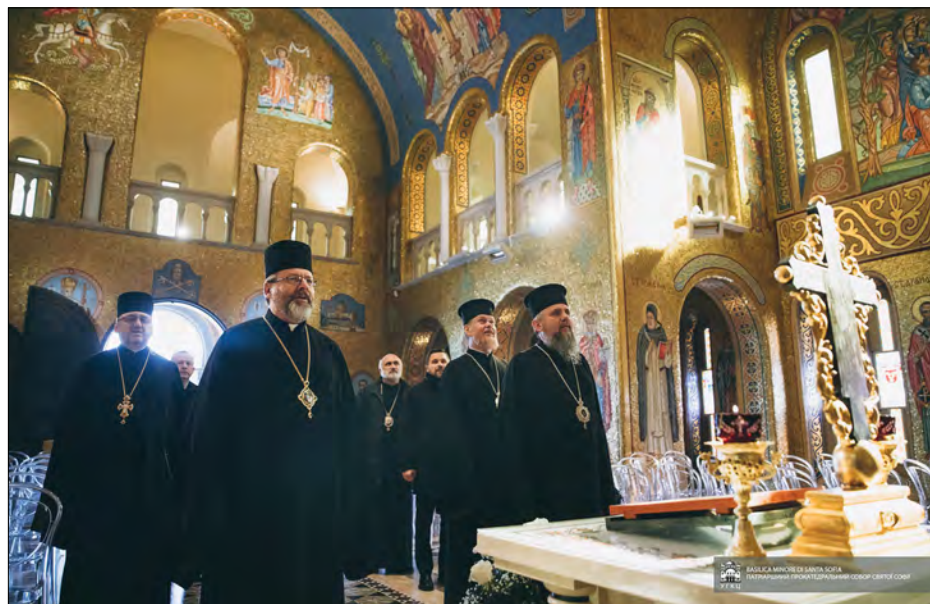
Члени делегації у прокатедральному соборі Святої Софії в Римі.

Вітаючи членів делегації у прокатедральному соборі Святої Софії в Римі, Блаженніший Святослав розповів історію заснування цієї святині, про її історичне значення для українського народу та душпастирське служіння в сучасних обставинах. Глава УГКЦ наголосив, що „цей собор завжди був символом єдності „в розсіянні суцього“ українського народу, а в сучасних обставинах, зокрема після повномасштабного російського вторгнення, став важливим духовним і