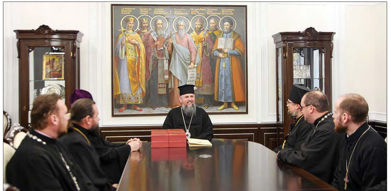
Священиків зі Сміли приймає Митрополит Епіфаній.