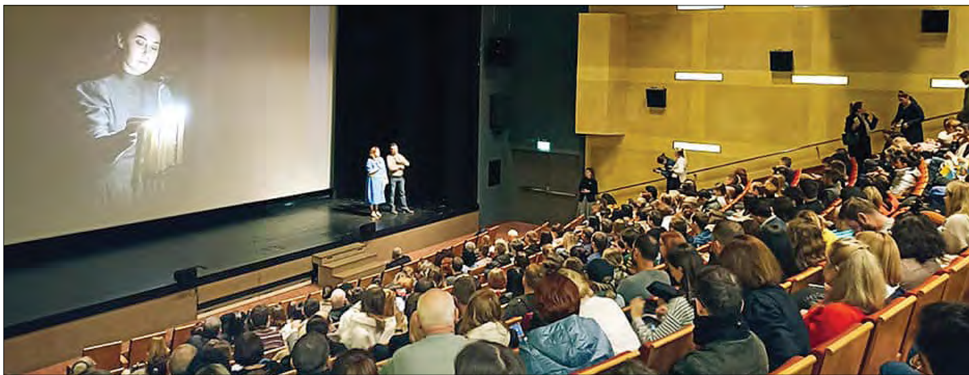
На прем'єру фільму прийшли як етнічні українці, так і представники інших національностей.

Найближчим часом художній фільм „Щедрик“, який зняла українська режисерка Олеся Моргунець-Ісаєнко за сценарієм Ксенії Заставської буде демонструватися в інших містах Ізраїлю. На думку авторів фільму його показ в єврейській державі має сенс ще й тому, що до перегляду фільму долучилися івритомовні ізраїльтяни, які тепер знатимуть правду про взаємини двох народів в роки Другої світової війни.