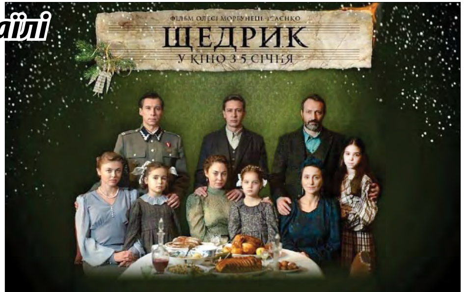
Афіша фільму „Щедрик“