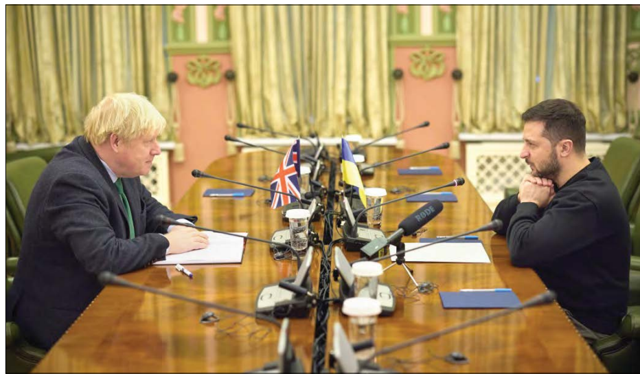
Президент України Володимир Зеленський зустрічається з Борисом Джонсоном.

КИЇВ. – 22 січня Президент України Володимир Зеленський зустрівся з колишнім Прем'єр-міністром Великої Британії, членом британського парламенту Борисом Джонсоном, який перебував з візитою у Києві. Під час зустрічі В. Зеленський і Б. Джонсон обмінялися думками щодо практичних кроків, які може здійснити британський політик для того, щоб допомогти Україні в цей важкий час. Зокрема, обговорювалося питання підготовки „саміту миру“, який планують провести з метою здійснення формули миру, яку Президент представив лідерам „Групи двадцяти“