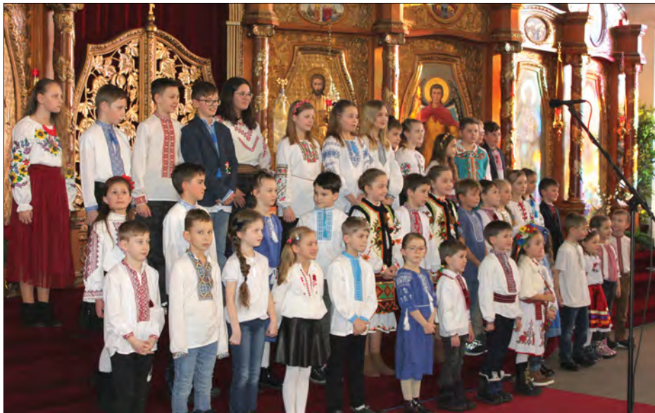
Рідна школа при парафії св. Юрія Переможця