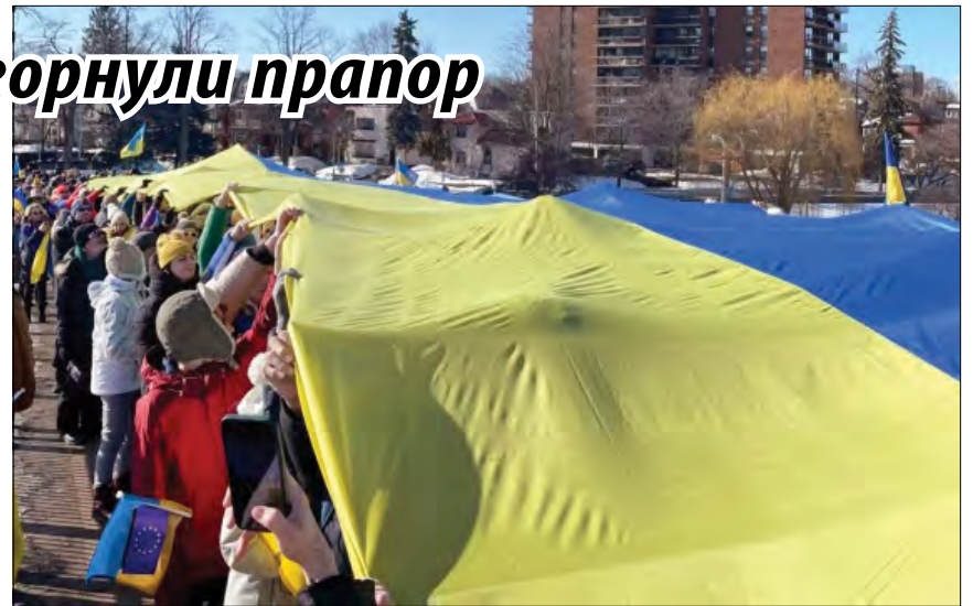
Учасники акції з прапором України.

До акції долучилося багато дипломатів різних країн. Зокрема, Посол ФРН Сабін Шпарвассер зазначила: „Це вияв солідарності з Україною, державою, яка хоробро захищає себе від жорстокого нападу, боронячи свою ідентичність,