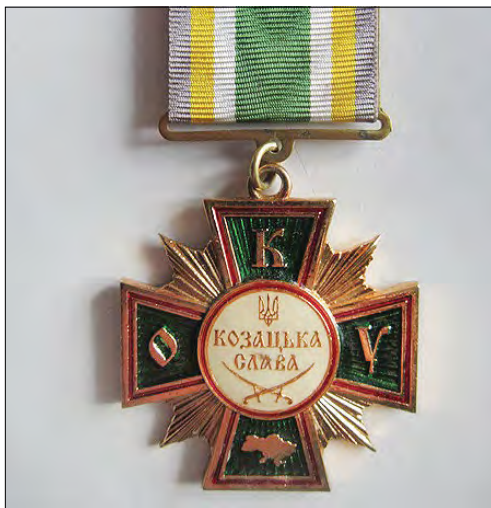
Відзнака „Козацька Слава” I ступеня