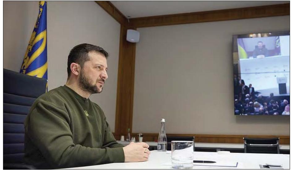
На конференції виступає Президент України Володимир Зеленський.

„Це буде марний діалог. Насправді Макрон марнує час. Я дійшов висновку, що ми не в змозі змінити став-