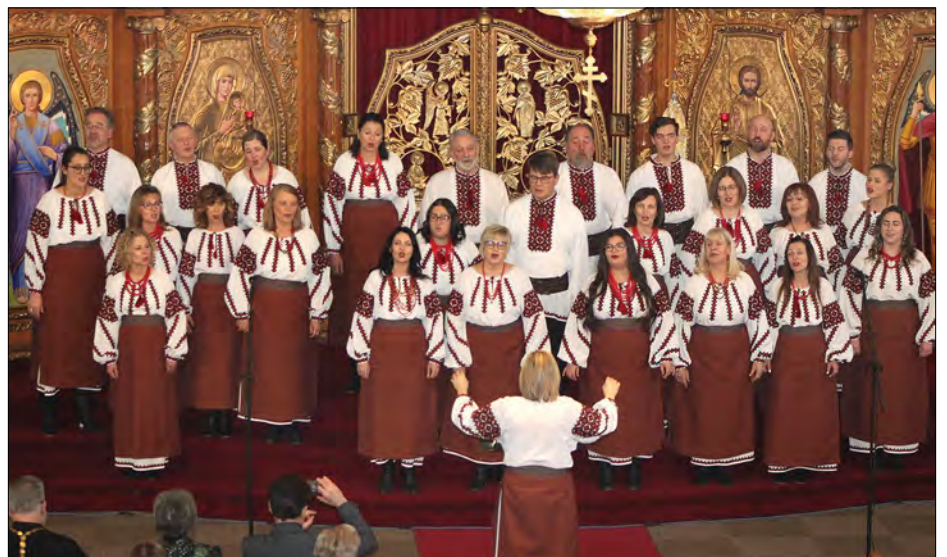
Український народний хор „Вітер“

їнців, старших та дітей. Звучали старовинні та традиційні колядки та щедрівки, в класичних обробках українських композиторів та в нових, включаючи аранжування українських канадців. А на завершення гарно було слухати традиційного „Щедрика“ Миколи Леонтовича у виконанні збірного хору всіх колективів (диригент Ірина Шмігельська), що брали участь в концерті.