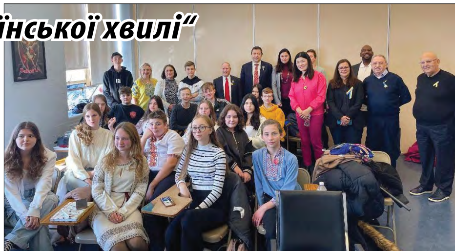
Спільне фото старшокласників з гостями школи.

Серед компаній які взяли участь були United Health Care; Holocaust Remembrance-Help for Refugees; Українська національна федеральна кредитна спілка; Українська кредитна спілка „Самопоміч“; Chase Bank; Іміграційна довідкова служба (Immigration Coalition; „Acme“ та Premium“ Home Care, компанія „Міст“; Комісія з громадської активності міста Нью-Йорк (NY Civic Engagement Commission), а також приватні адво-