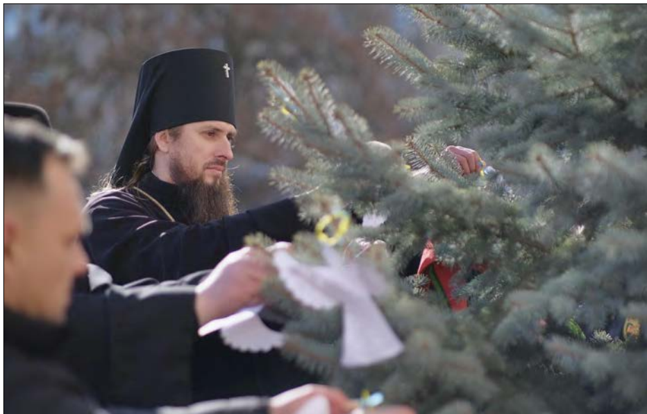
Архієпископ Марк під час акції.