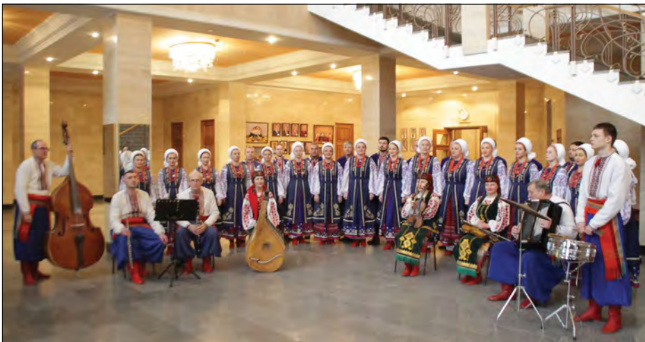
Виступає Черкаський народний хор.