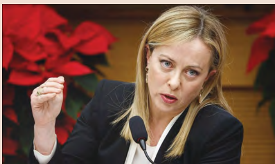
Прем'єр-міністр Італії Джорджа Мелоні

КИЇВ. – Прем'єр-міністр Італії Джорджа Мелоні прибула до Києва 21 лютого. У столиці України вона провела переговори з Президентом України Володимиром Зеленським.