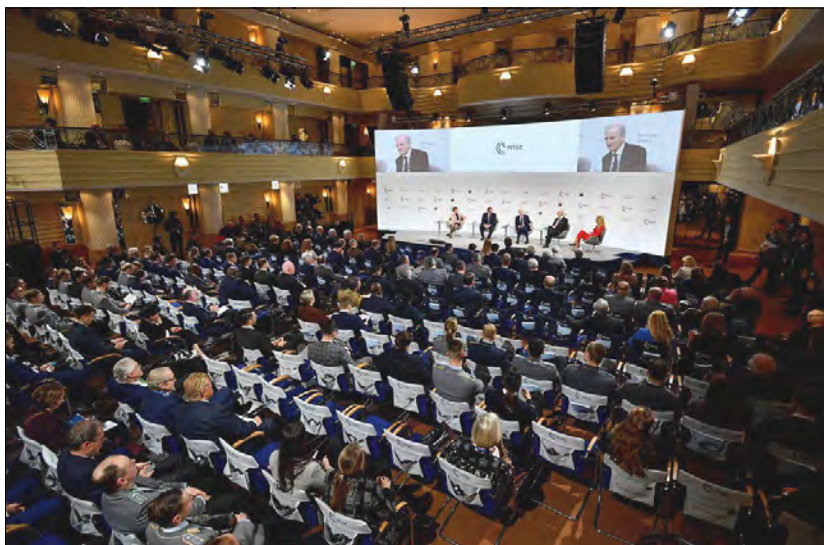
Під час Мюнхенської безпекової конференції.

Командувач Об'єднаних сил НАТО в Європі генерал Крістофер Каволі виступив за передачу Україні ракет великої дальності та винищувачів F-16. Таку саму позицію висловила і експікерка Палати представників Конгресу США Ненсі Пелосі: „Зараз Україна просить винищу-