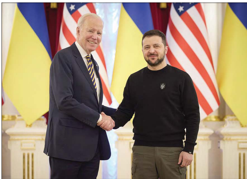
Президент України Володимир Зеленський зустрівся з Президентом США Джоозефом Байденом.

Президенти відвідали Свято-Михайлівський Золотоверхий