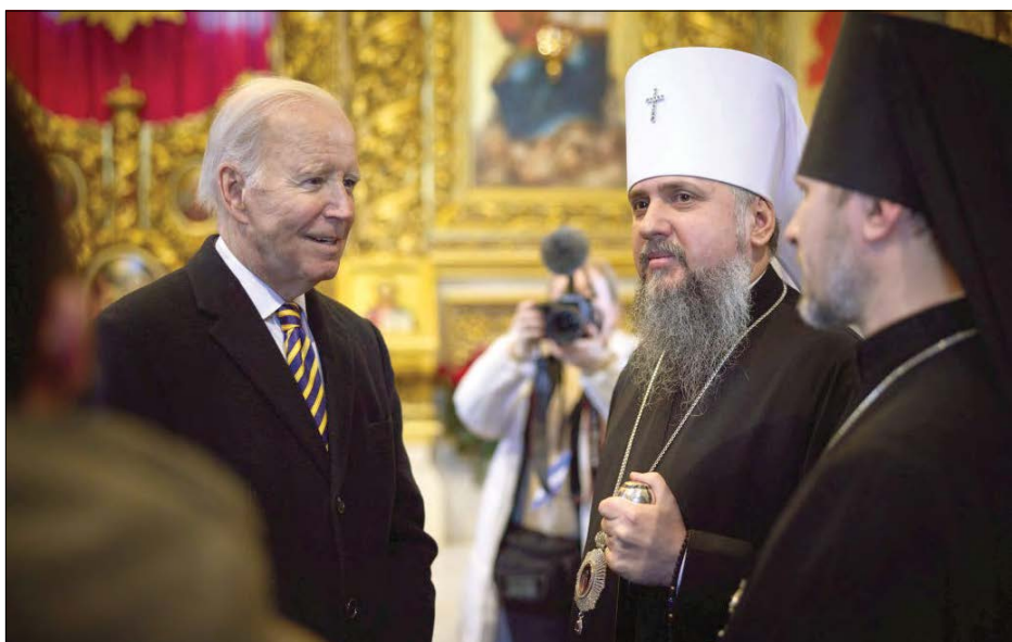
Митрополит Єпіфаній і Джо Байден у Свято-Михайлівському Золотоверхому монастирі.