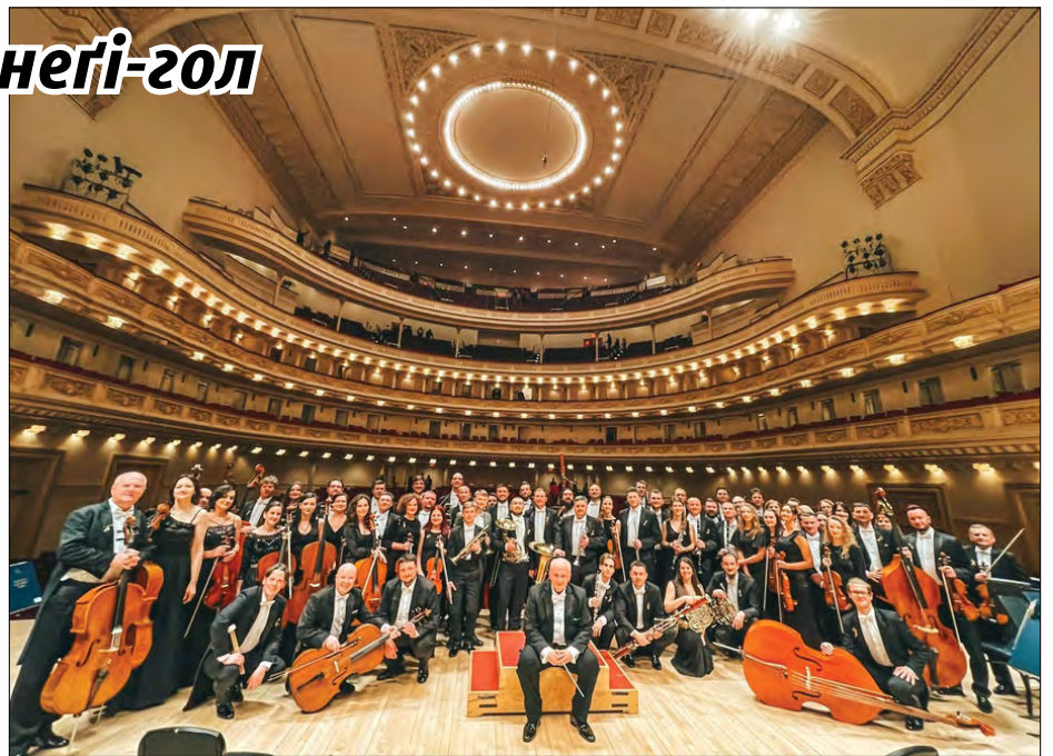
Академічна симфонічна оркестра Львівської національної філармонії у концертній залі Карнегі-гол.

„Оркестра залишила колосальне враження – це зі слів слухачів та президента Карнегі-гол. Після завершення виступу мене викликали на сцену оплесками п'ять разів, аж поки ми не заграли на біс та і після нього я виходив на сцену п'ять разів. Я певний, що з часом усі усвідомлять, що сьогоднішній вечір набагато важливіший, ніж просто виконання Станковича, Брамса і Дворжака – насправді, це можливо, найважливіший вечір у сучасній українській історії. Це був колосальний вечір в контексті всього, що Карнегі-гол