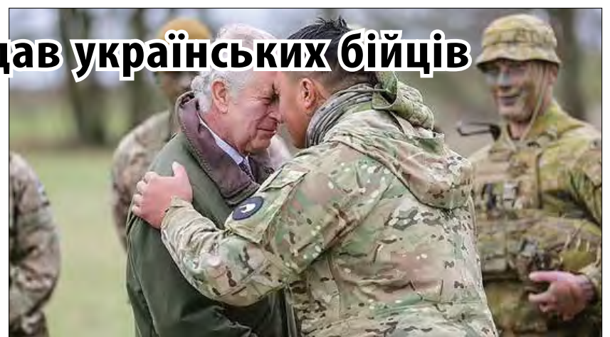
Король Чарльз спілкується з українськими військовими.

8 лютого в ході візиту до Великої Британії Президент Володимир Зеленський разом із