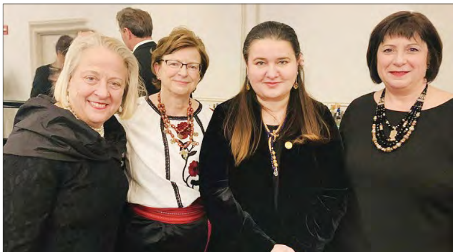
Посол України в США Оксана Маркарова (третя зліва): в Школі українознавства ім. Тараса Шевченка. у Вашингтоні.

ВАШІНґТОН. – Посол України в США Оксана Маркарова завітала на святковий захід з нагоди 60-ї річниці з офіційної реєстрації Школи українознавства ім. Тараса Шевченка у Вашингтоні. У своєму вітальному слові вона наголосила, що Школа українознавства – це важливий осередок академічного та громадського життя, який єднає кілька поколінь укра-