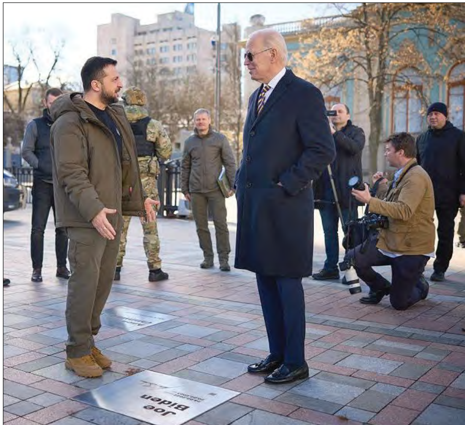
Президенти на відкритті іменної таблички, присвяченої Джо Байдену.

Офіційне інтернет-представництво Президента України