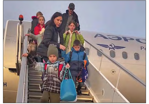
Викрадені українські діти у Мурманську. Вересень 2022 року.

Однією із ключових фігур у системі переміщення українських дітей автори доповіді вважають дитячого омбудсмена Росії Марію Львову-Белову. А також першого заступника глави адміністрації