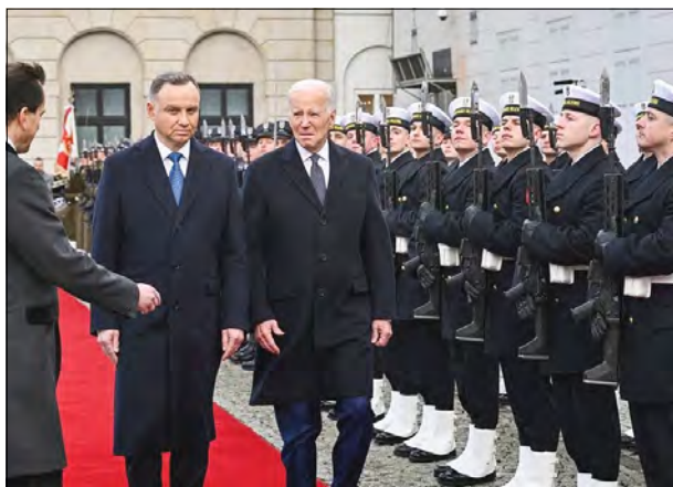
Президент США Джо Байден та Президент Польщі Анджей Дуда, Варшава, 21 лютого 2023 року.

Наступного дня Президент США зустрівся у Варшаві з лідерами "Букарештської дев'ятки"