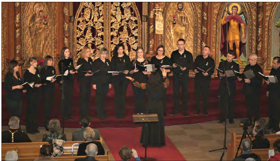
Хор „Нове життя“ при парафії св. Василя Великого

Вже 12-ий концерт відбувається в катедрі Едмонтону – виступи чергуються між православною та католицькою катедрями. У концерті брали участь 12 хорів. І це не всі хори, які існують в Едмонтоні. Слід зазначити численну участь новоприбулих укра-