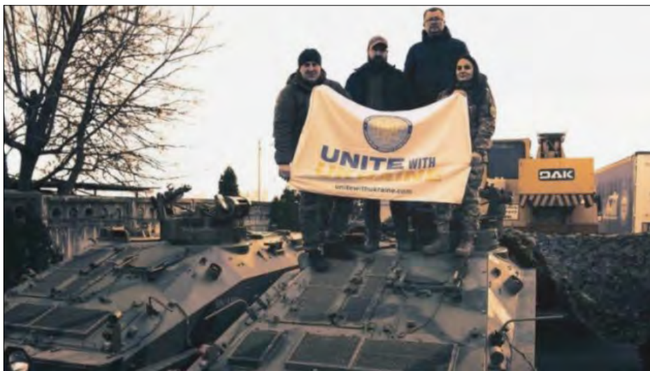
Бойові машини для України.