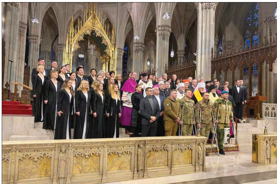
Екуменічна молитва в соборі св. Патрика в Нью-Йорку.

НЬЮ-ЙОРК. – У соборі св. Патрика відбулась екуменічна молитва на вшанування роковин від початку повномасштабної війни Росії проти України. Літургію провели на запрошення Римо-католицького архієпископа міста кардинала Тімоті Долана та Митрополита Бориса Гудзяка (Українська католицька архієпархія Філадельфії).