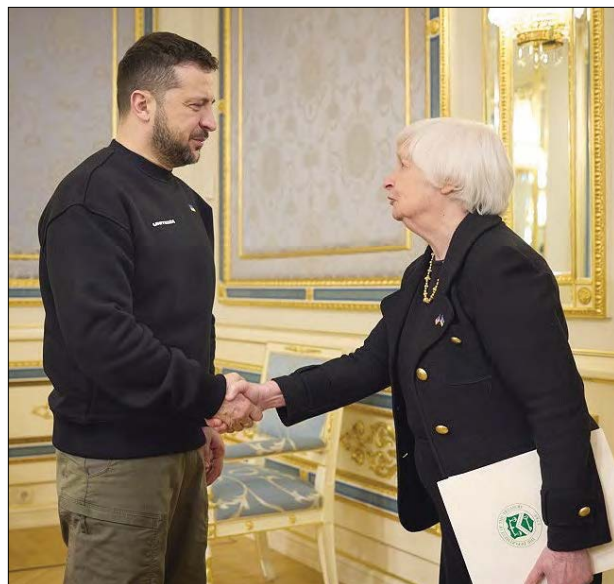
Президент України Володимир Зеленський і Міністер фінансів США Джанет Єллен.

КИЇВ. – 24 лютого Президент Володимир Зеленський виступив у форматі відеоконференції на зустрічі лідерів „Групи семи“. „Ми почали звільняти нашу землю від російського зла. Ми повертаємо безпеку в міжнародні відносини. І ми з вами