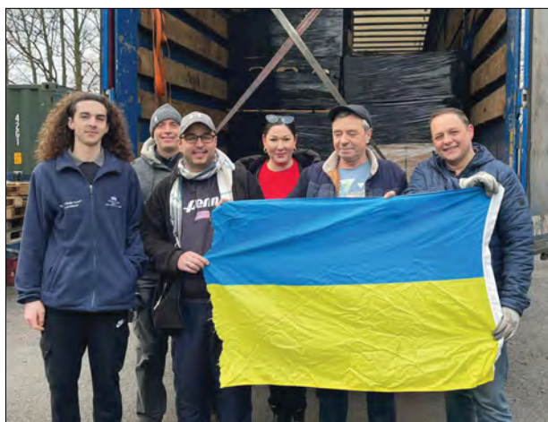
Волонтери з Бережан.