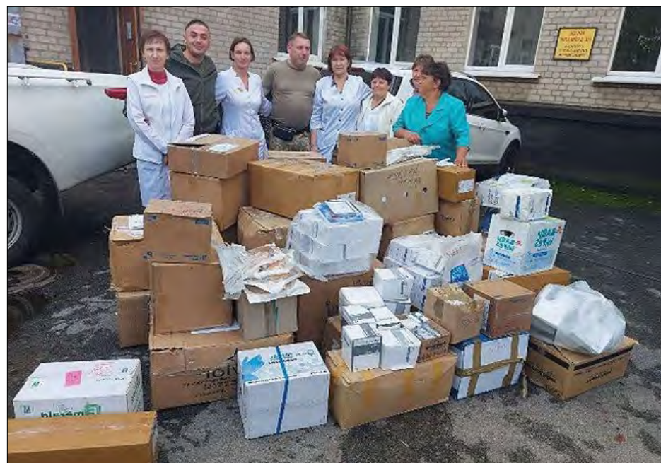
Допомога для лікарні в Павлограді Донецької області.

У вечірніх вістях СТВ була обширна згадка про подію і декілька інтерв'ю.