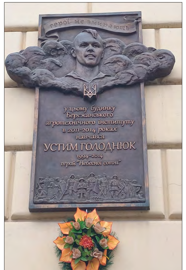
Меморіальна таблиця Устиму Голоднюку в Бережанах.

Недавно ще один провулок у центрі Бережан названо на честь українського журналіста Георгія Гонгадзе. Тут пройшло дитинство його дружини Мирослави Гонгадзе.