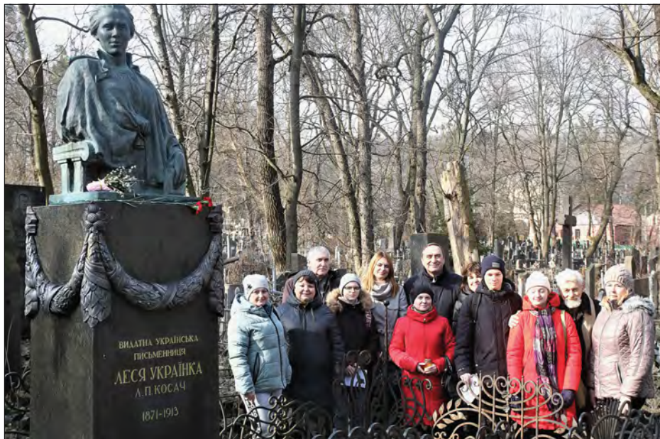
Кияни на Байковому кладовищі Києва.