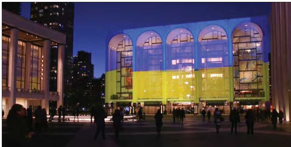
Будівлю Метрополітен-опери в Нью-Йорку підсвічено синьо-жовтими прожекторами (Фото: „Голос Америки“).