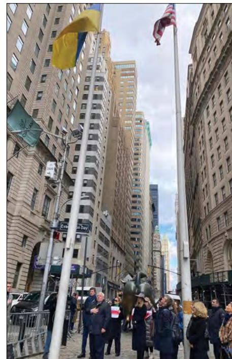
Піднесення українського державного прапора в Нью-Йорку.

В Українському інституті Америки відбувся захід до річниці війни, в якому взяли участь губернатор штату Нью-Йорк Кеті Гокул, конгресвумен Марсі Каптур, а також міністер закордонних справ Великої Британії Джеймс Клеверлі, який завітав до