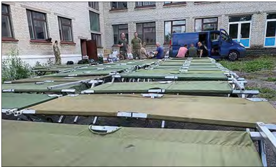
Подаровано польовому шпиталю в Покровську Донецької області розкладні ліжка для хворих та місцевих громадян-переселенців.

$46,000 допомоги переселенцям в Україні та населенню в бойових зонах та $578,034 іншої допомоги, котра включає п'ять машин швидкої допомоги, чотири машини для транспортування гуманітарної допомоги або хворих. Окремо треба відзначити чотири спеціальні обладнання і два роботи для розмінування на суму $182,098.