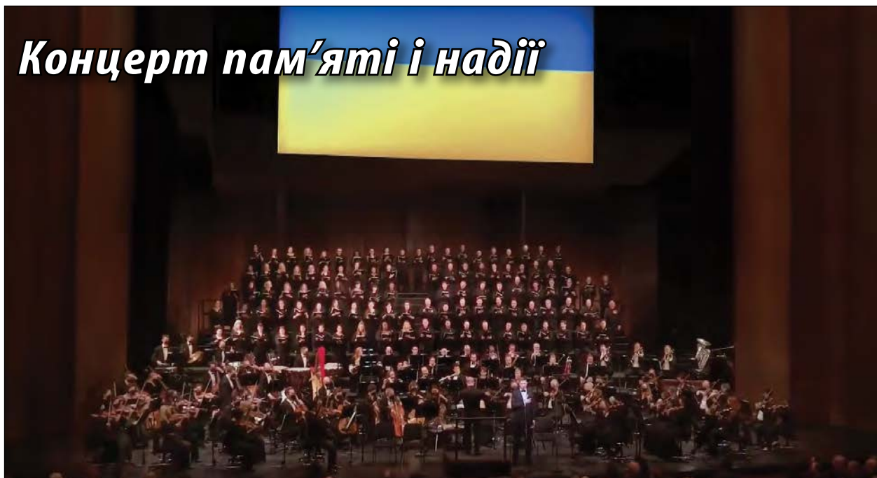
Під час концерту пам'яті і надії „За Україну“ в Метрополітен-опері в Нью-Йорку

НЮ-ЙОРК. – У Метрополітен-опері 24 лютого відбувся концерт пам'яті і надії „За Україну“, присвячений річниці боротьби українського народу проти російської агресії.