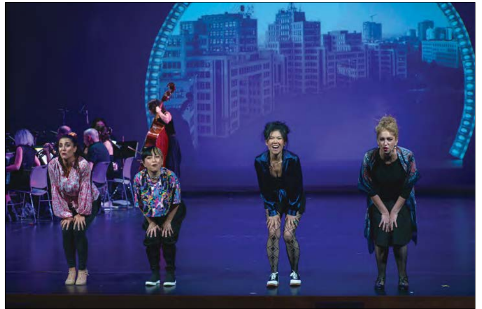
Сцена з вистави про Харків

НЮ-ЙОРК. – Нова вистава „RADIO 477!“ про Харків у 1929 році і сьогодні створена Yara Arts Group та українськими мистцями у співпраці з Сергієм Жаданом буде представлена у театрі La MaMa's Ellen Stewart Theatre. Покази відбудуться 10-19 березня, як повідомила Міа Ю, художній директор театру. Перший показ відбудеться 10 березня, показ для преси – 12 березня.