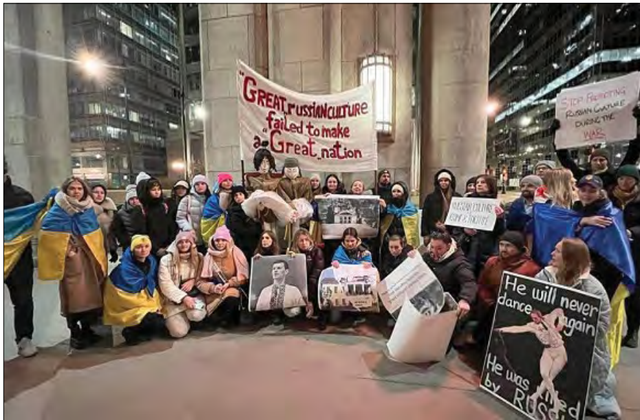
Акція протесту в Чикаго проти просування російської культури

ЧИКАГО. – Біля будівлі Громадянської опери 17 лютого відбулася акція протесту проти просування російської культури – кілька десятків демонстрантів засудили постановку балетної групи The Joffrey Ballet за мотивами російського роману „Анна Кареніна“.