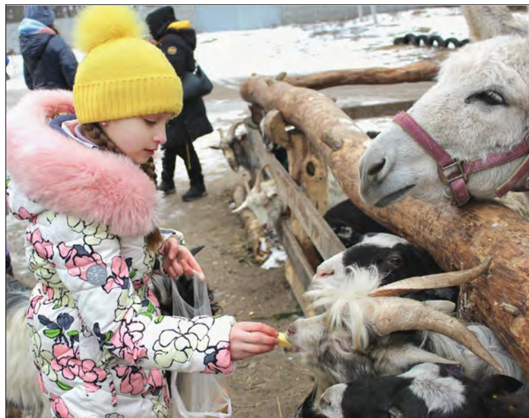
Під час акції у зоопарку.