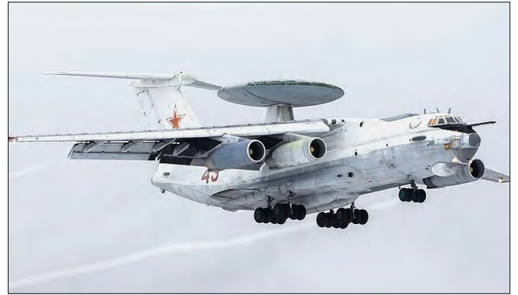
Літак А-50 може служити командним пунктом.

Група „Беларускі Гаюн“, яка відстежує маневри російської та білоруської армій на території Білорусі, повідомила з посиланням на місцевих мешканців про два вибухи в районі летовища 26 лютого. Силовики розшукують підозрюваного (у розісланому орієнтуванні сказано – „за скоєння особливо тяжкого злочину у селищі Мачуліщі“) –