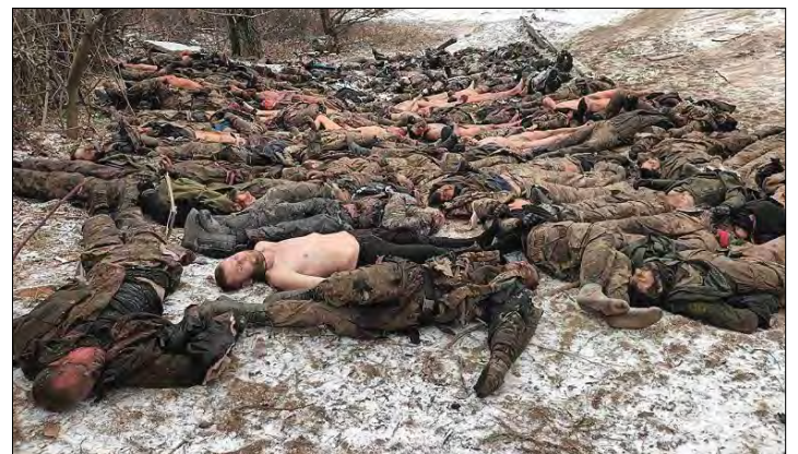
Пригожин показав трупи полеглих росіян.

Раніше заступниця Міністра оборони України Ганна Маляр повідомляла, що на сході в деяких