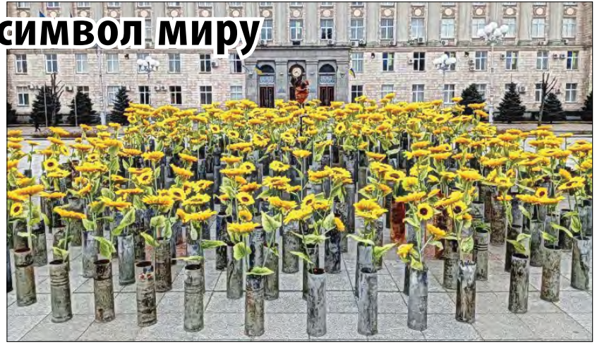
Соняшники, виставлені до річниці початку війни.

В основі композиції – 365 відстріляних бойових гільз від снарядів, з яких проростають соняхи. В її центрі – понівечене, розтерзане, але живе серце „Війна – це біль”, виготовлене черкаським скульптором Романом Турецьким. Використаний боєприпас символізує кожен день, коли агресор завдавав ракетних