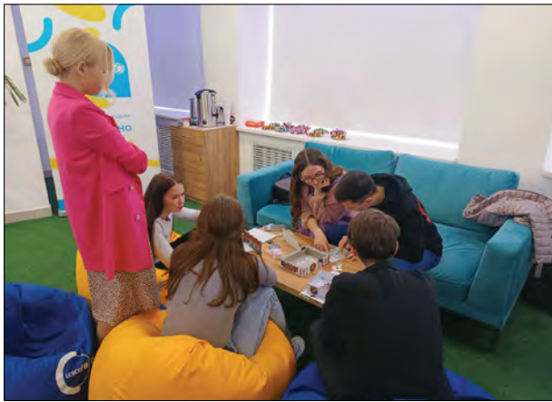
В одному з тематичних куточків молодіжного простору „Кома”.