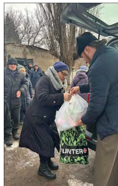
Привезли допомогу до Костянтинівки.