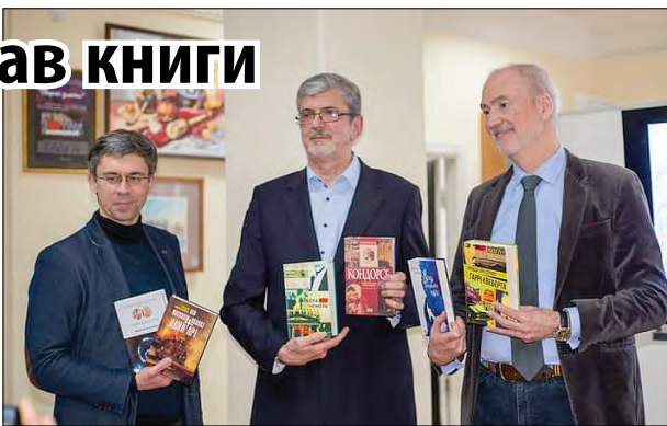
Представники Посольства дарують книги науковій бібліотеці. Справа крайній Посол Франції в Україні Етьєн де Понсен.

Представники посольства подарували обласній універсальній науковій бібліотеці 200 книг французьких та франкомовних авторів, перекладених