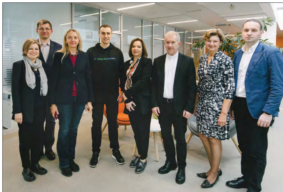
Учасники панельної дискусії в УКУ

В. Ляшко наголосив на важливості не лише профільної медичної освіти,