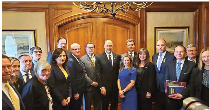
Представники української діаспори під час зустрічі з Денисом Шмигалем і Христеною Фріланд.

українському народу за відважний захист України у війні, розв'язаній Росією.