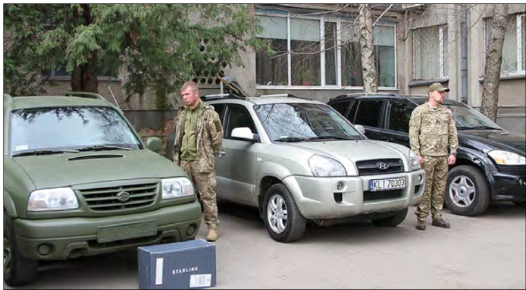
Машини з Сміли для фронту.

СМІЛА, Черкаська область. – 24 березня на фронт відправлена чергова партія допомоги від Черкаського району. У Смілі було вручено ключі від авт, а також засоби зв'язку українським воїнам, котрі дають рішучий відпір російським агресорам.