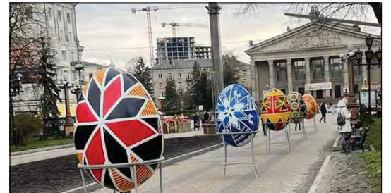
Розмальовані писанки у центрі Тернополя.

крашали Великодні кошики та свічки, співали гаївки. Потім великими писанками було прикрашено центральну площу міста. Також тернополяни привезли Великодні подарунки та паски солдатам на війні, щоб вони відчували святковий настрій і родинний затишок.