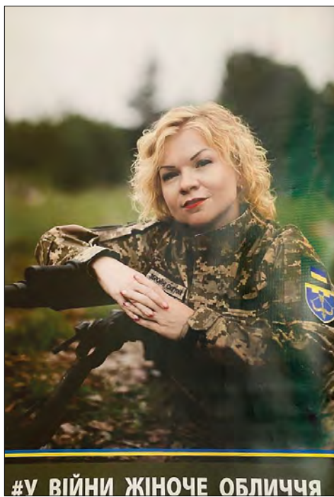
#У ВІЙНИ ЖІНОЧЕ ОБЛИЧЧЯ

Мета проєкту – показати, що жінки боронять Батьківщину нарівні з чоловіками, що захист країни – не лише справа чоловіків. Проєкт було презентовано минулого року до Дня захисників і захисниць України у Центрі „Любава” та встиг бути представлений у навчальних закладах міста. Багато українок вступило до лав територіальної оборони. У