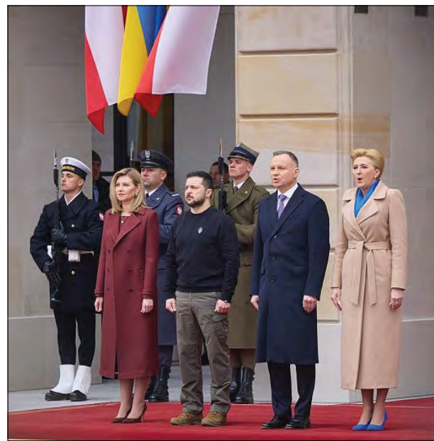
Під час офіційної візити до Польщі Президента України Володимира Зеленського.

Зі свого боку А. Дуда наголосив, що для нього велика радість від імені всіх поляків вітати у Варшаві Президента України В. Зеленського та першу