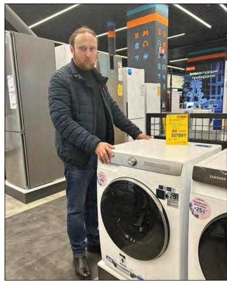
Пральні машини для біженців та переселенців у Авдіївці

Одяг, зимові куртки та черевики, а також продукти харчування регулярно отримують і доставляють чоловікам і жінкам Збройних сил України, які охороняють межі Костянтинівки та приміські села.