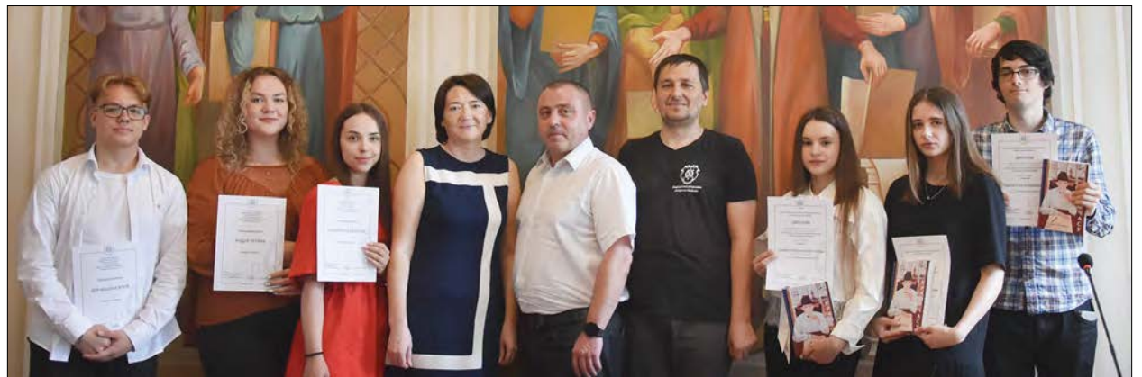
Переможці X Всеукраїнського конкурсу для студентської та учнівської молоді.