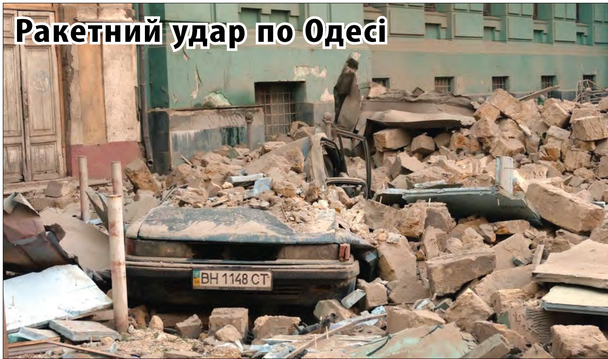
Руйнування в Одесі після ракетного удару.