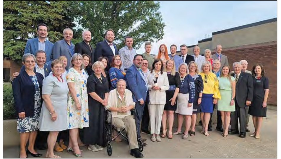
Гостей з України приймають в Едмонтоні.

ЕДМОНТОН. – Посол України в Канаді Юлія Ковалів і делегація Верховної Ради України у складі Микити Потураєва, Євгенія Кравчук, Ірини Герасенко здійснили візит до Альберти. Під час поїздки було проведено зустрічі з прем'єром Альберти, губернатором, спікером парламенту, мером Едмонтона, провідниками української громади, діловими кола-