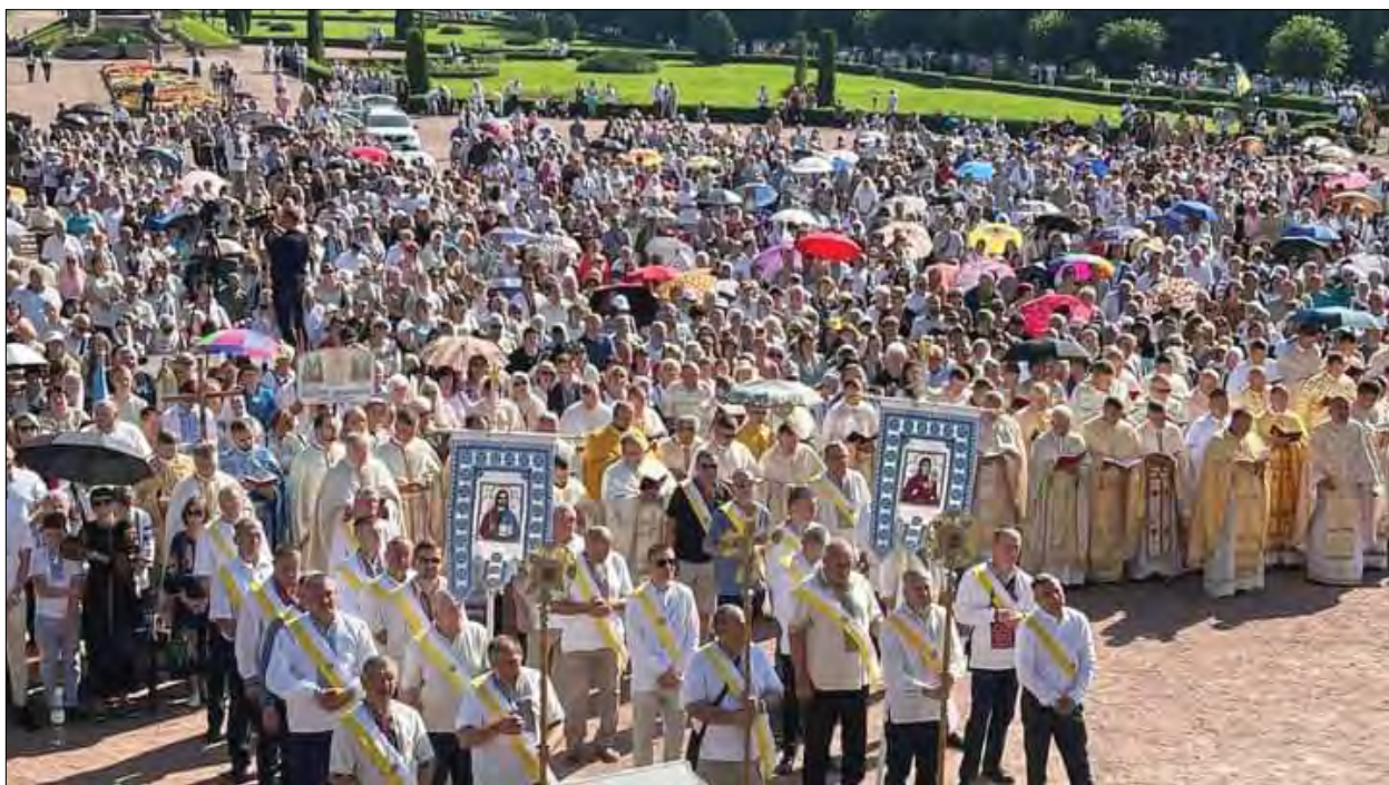
На Всеукраїнській прощі до Зарваниці.