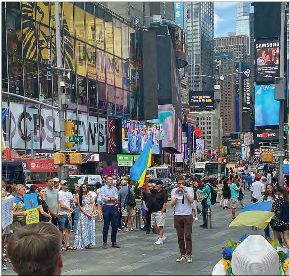
Українці провели акцію в Нью-Йорку.

НЬЮ-ЙОРК. – На Таймс-сквері українці провели акцію проти рашистської агресії та закликали світову спільноту до колективної протидії „зерновому“ шантажу РФ й відновленню українського агроекспорту.