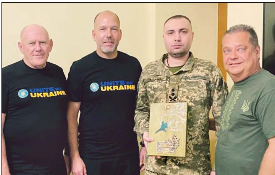
Зустріч з начальником Головного управління розвідки Міністерства оборони України Кирилом Будановим.