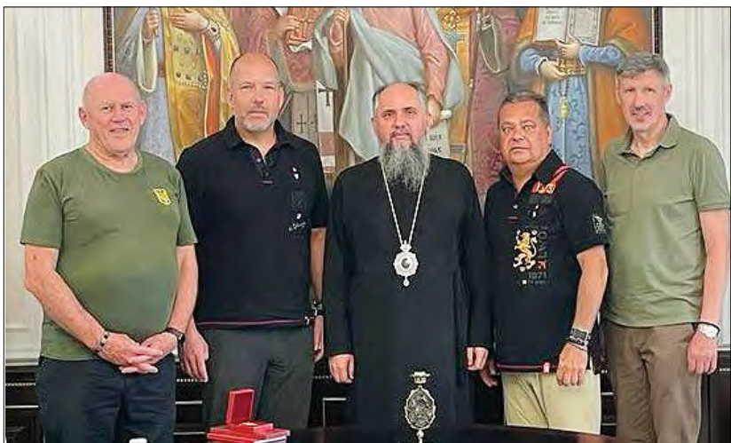
Делегація СКУ зустрічається з Митрополитом Єпіфанієм.

Відбулися зустрічі з Віце-прем'єр-міністром із відновлення України Олександром Кубраковим, міністром оборони України Олексієм Резніковим, начальником Головного управління розвідки Міністерства оборони України Кирилом Будановим, секретарем Ради національної безпеки і оборони України Олексієм Даніловим, Командувачем Сил територіальної оборони Збройних сил України, генералом-майором Ігорем Танцюрою, міністром енергетики України Германом Галущенком, міністром охорони здоров'я України Віктором Ляшком, міністром соціальної політики України Оксаною Жолнович, міністром культури та інформаційної політики України Олександром Ткаченком.