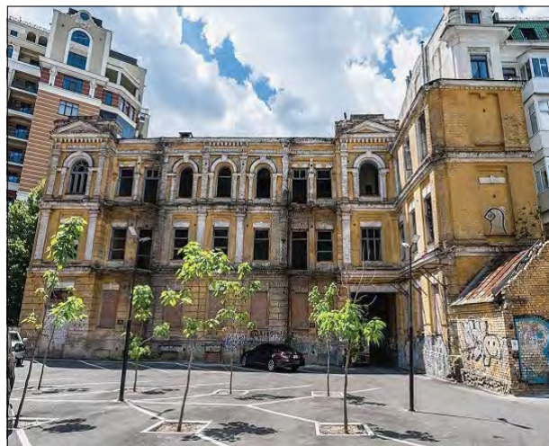
Садиба Сікорського в Києві.

КИЇВ. – Міністерство культури та інформаційної політики 13 липня погодило передачу садиби Сікорського у власність громаді Києва. Йдеться про будинок на вулиці Ярославів Вал, 15-Б, який належав родині Сікорських. Будівля має статус пам'ятки історії національного значення.