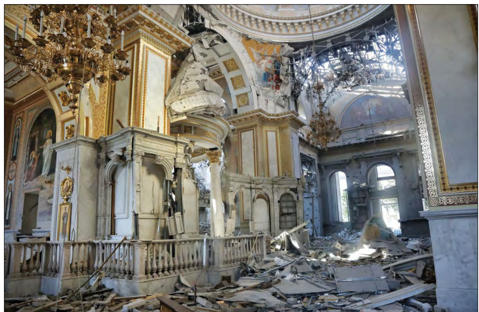
Руйнування в Спасо-Преображенському соборі

Будівля була зведена 1832 року за проектом архітектора Ф.К. Боффо. Архітектурний комплекс включає дві будівлі – особняк графа Толстого і прибудована до нього в 1896-1899 роках будівля картинної галерії.