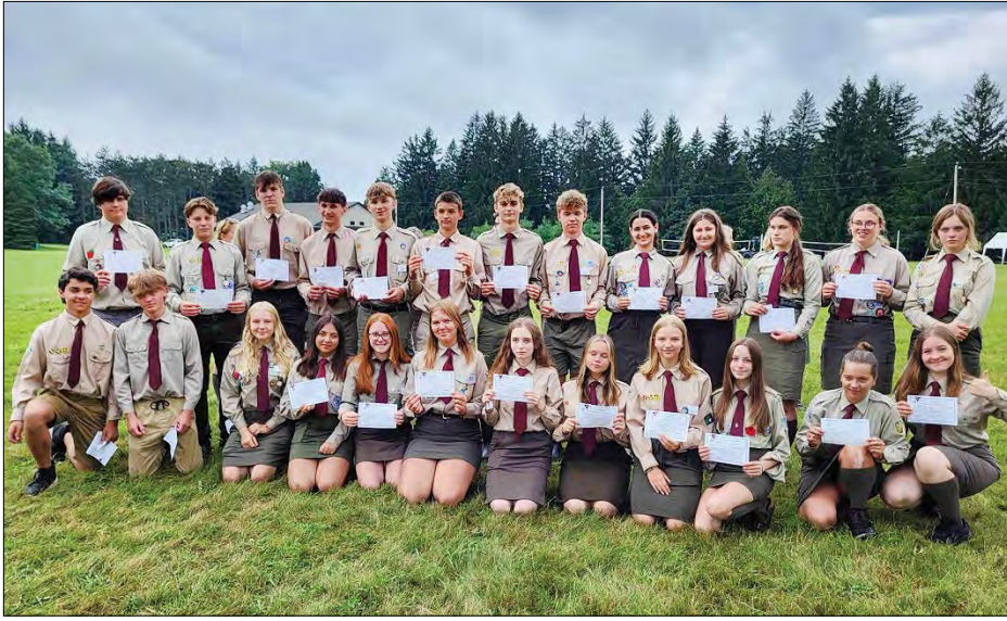
Учасники Всеканадського вишкільного табору.

Всеканадський вишкільний табір Спілки української молоді „Нині СУМівця, нині бійця“ ім. Патріярха Любомира Гузара на оселі СУМ „Веселка“ біля Актону (провінція Онтаріо, Канада) завершив свою діяльність.